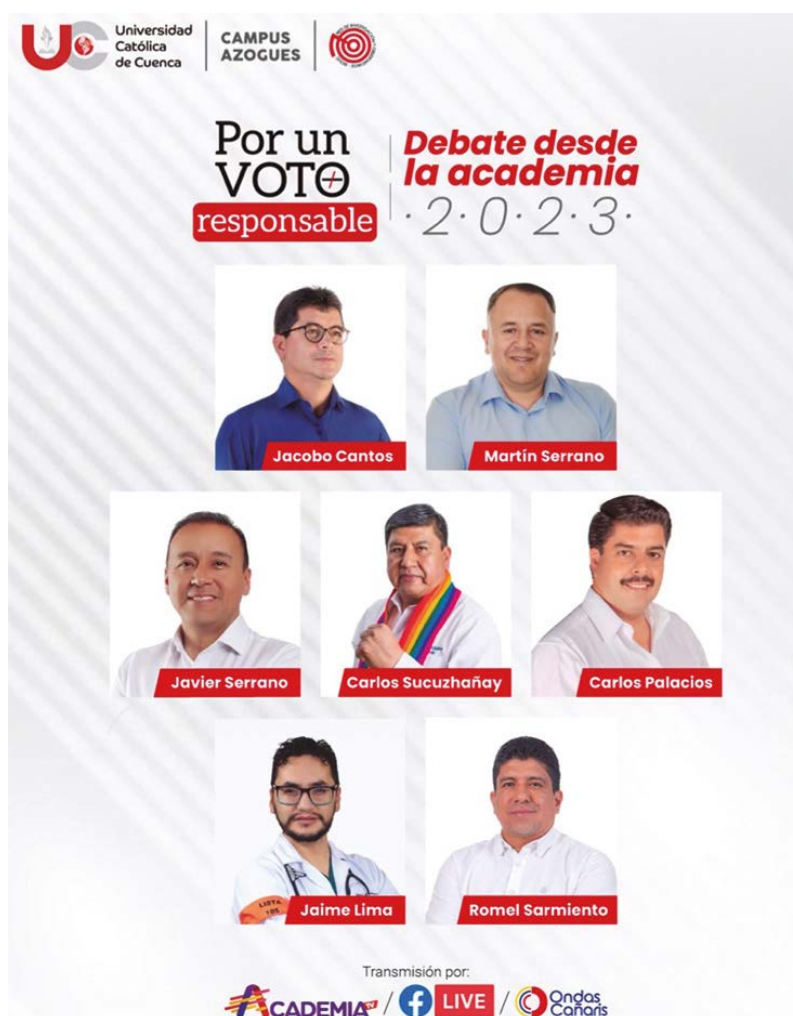
Figura 2. Candidatos a Alcalde de la ciudad de Azogues período 2023 -2027

Cada una de las intervenciones de los candidatos, permitió conocer su Plan de Trabajo y su posición frente a los cuatro ejes temáticos planteados por la academia, tomando en consideración la trascendencia que tiene para la ciudadanía la elección del Primer Personero Municipal.