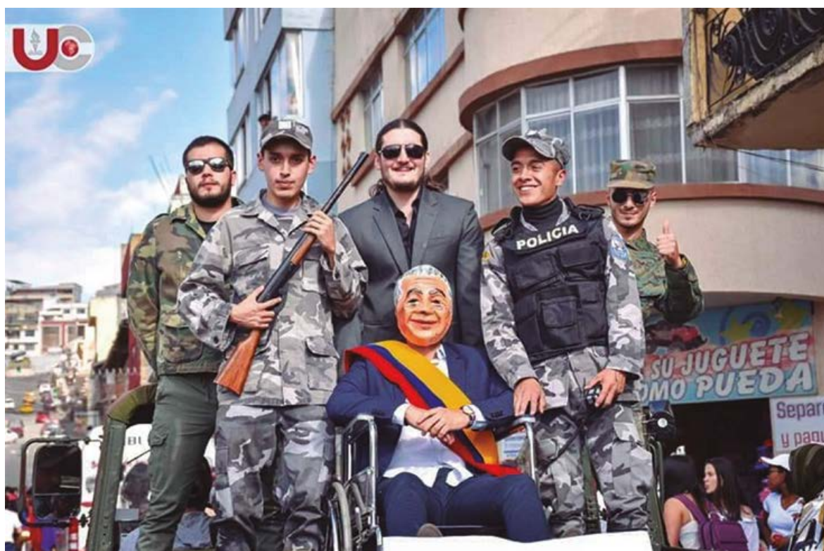
Figura 9. Comparsa los Zánganos del Páramo

Nota: Adaptado del archivo digital de Cato Unidad. Comparsa ganadora de la cuarta edición de las Mascaradas 2020