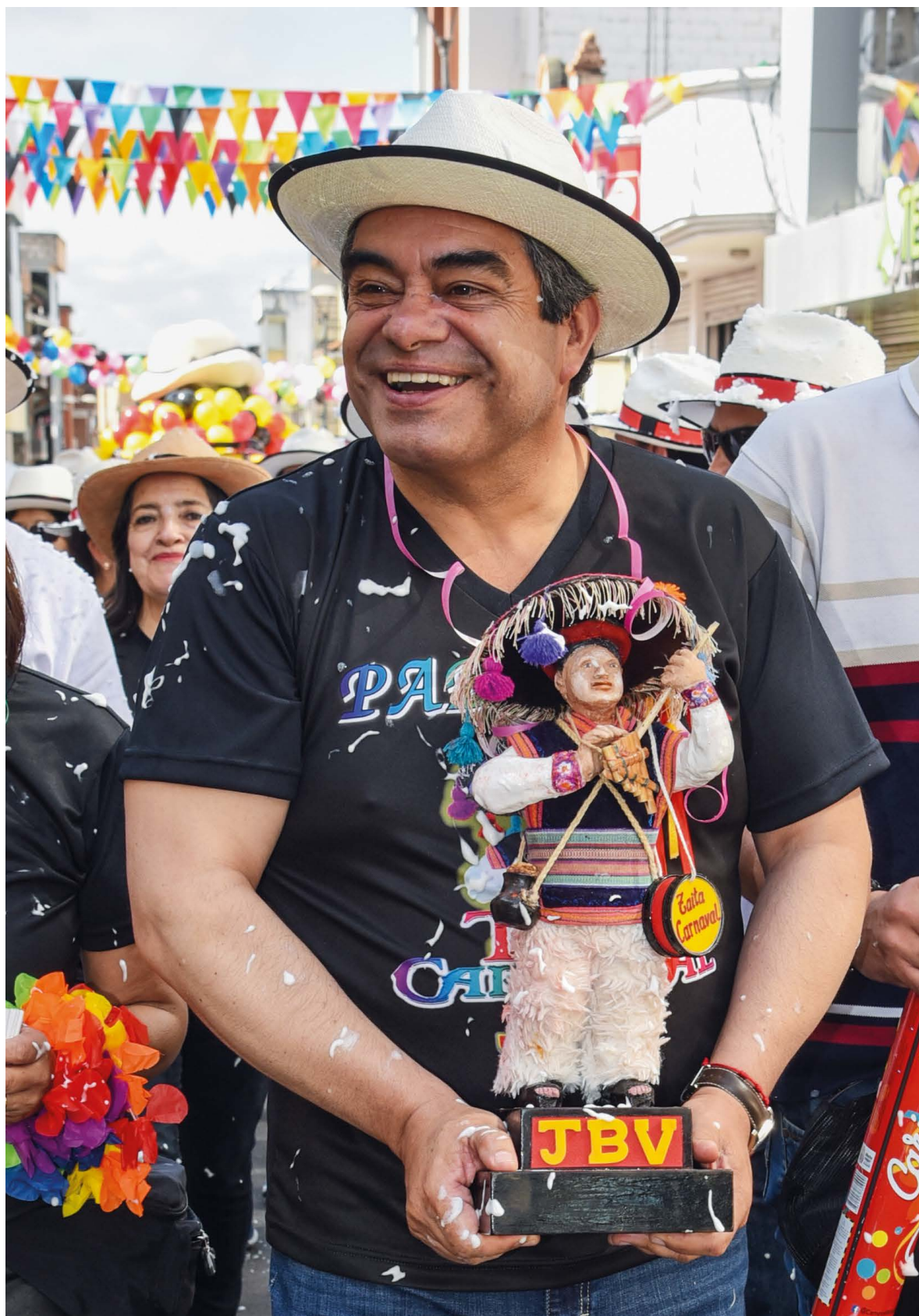
El padrino iniciando el recorrido con la efigie del Taita Carnival.