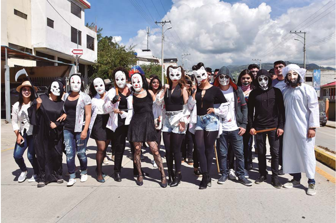
Estudiantes de Medicina y Odontología con sus disfraces y comparsas: Médicos en pañales, el payaso it, catrinas.