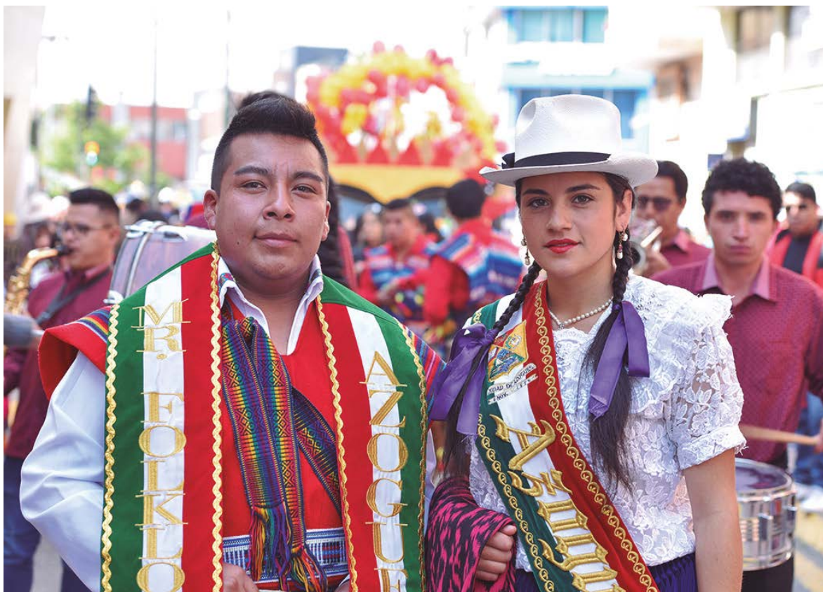
Mr. Folklor y Cholita Azogueña.