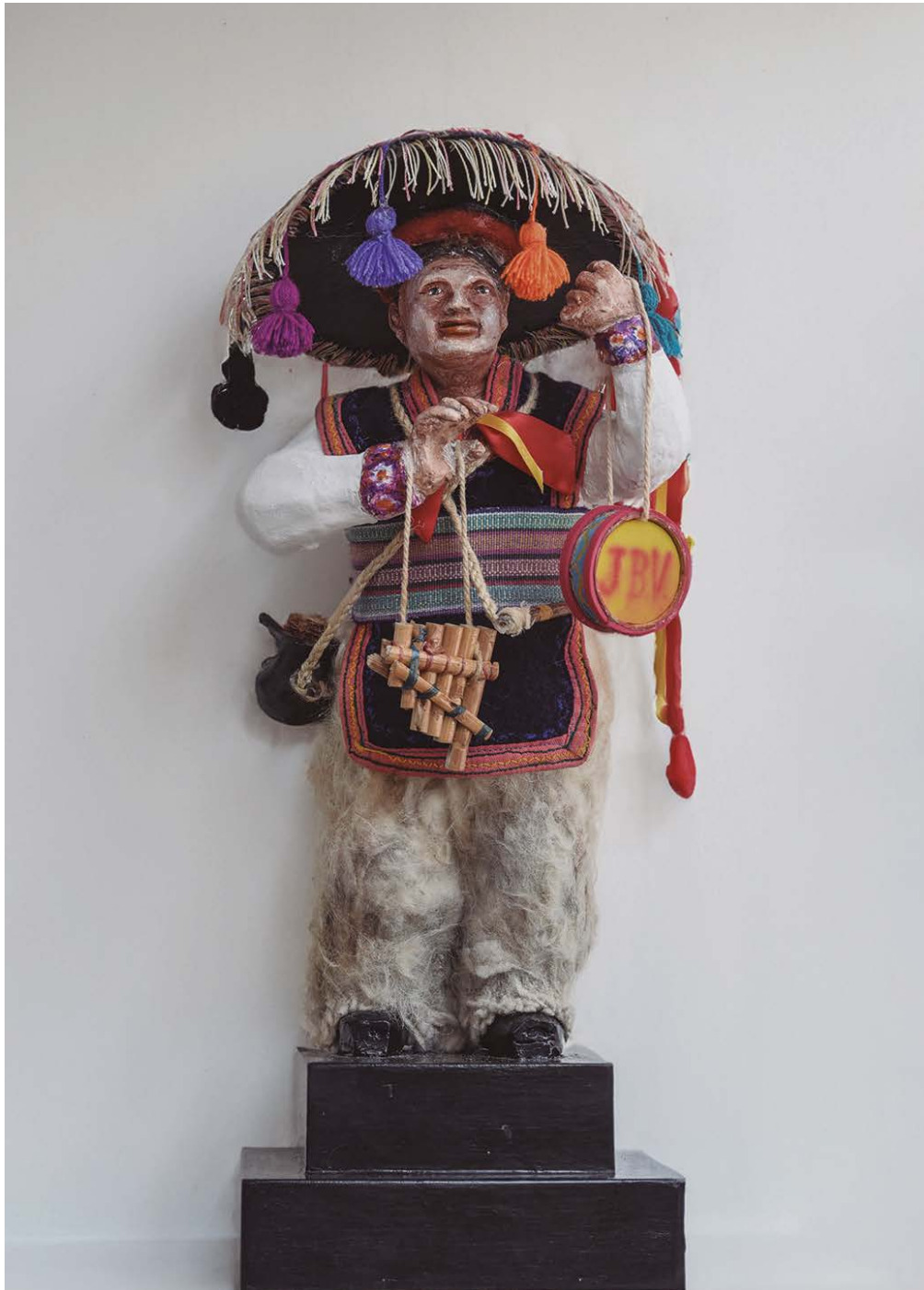
Efigie Tatia Carnaval.