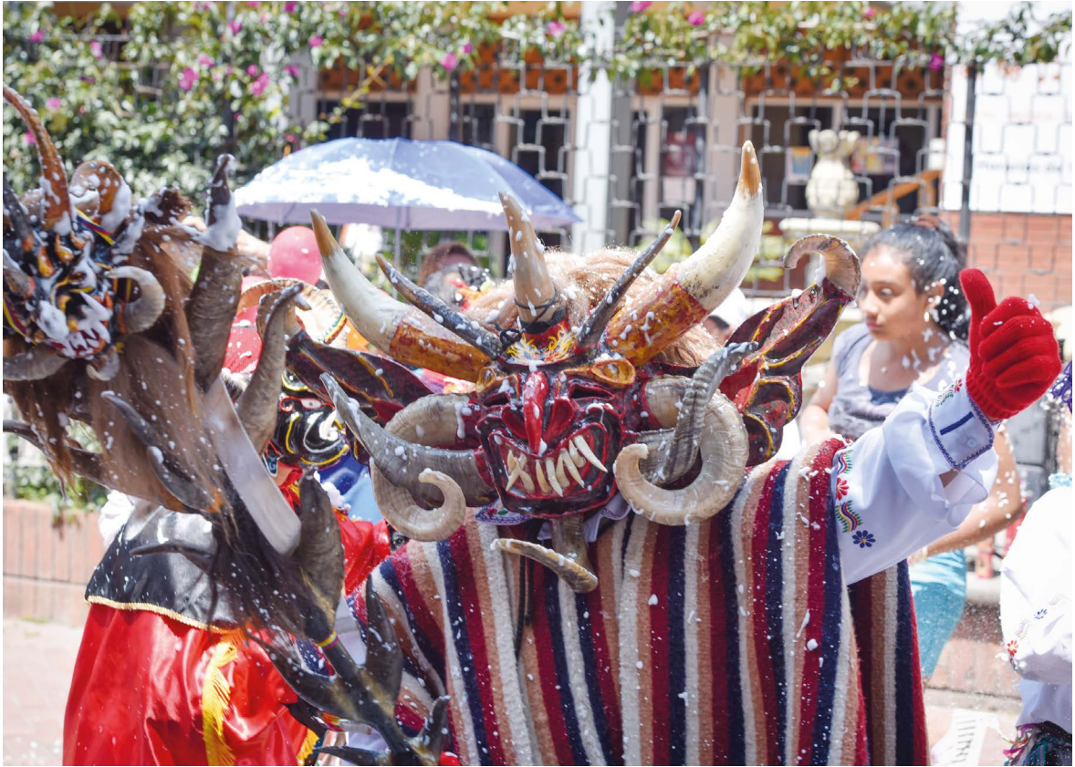
El Diablo del Carnaval con sus trajes y comparsas celebrando el carnaval como una fiesta popular.