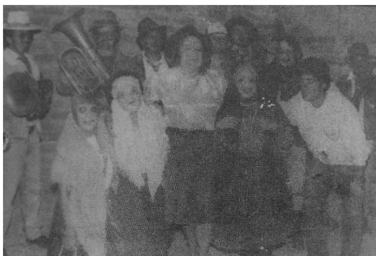
Figura 4. Mascaradas Biblián

Nota: Adaptado del archivo de Semanario El Espectador, 9 de enero de 1993. Comparsa de la Banda Municipal de Biblián acreedora del segundo puesto.