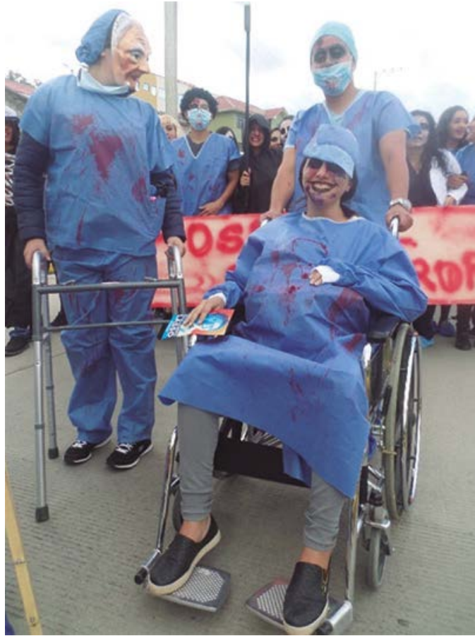
Figura 6. Comparsa de la carrera de Medicina y Ciencias de la Salud