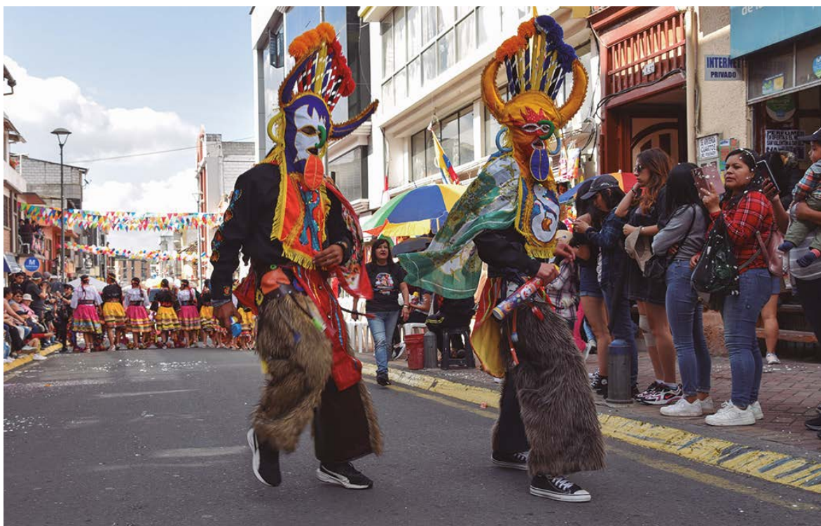
Danza folklórica de los ruku yayas.