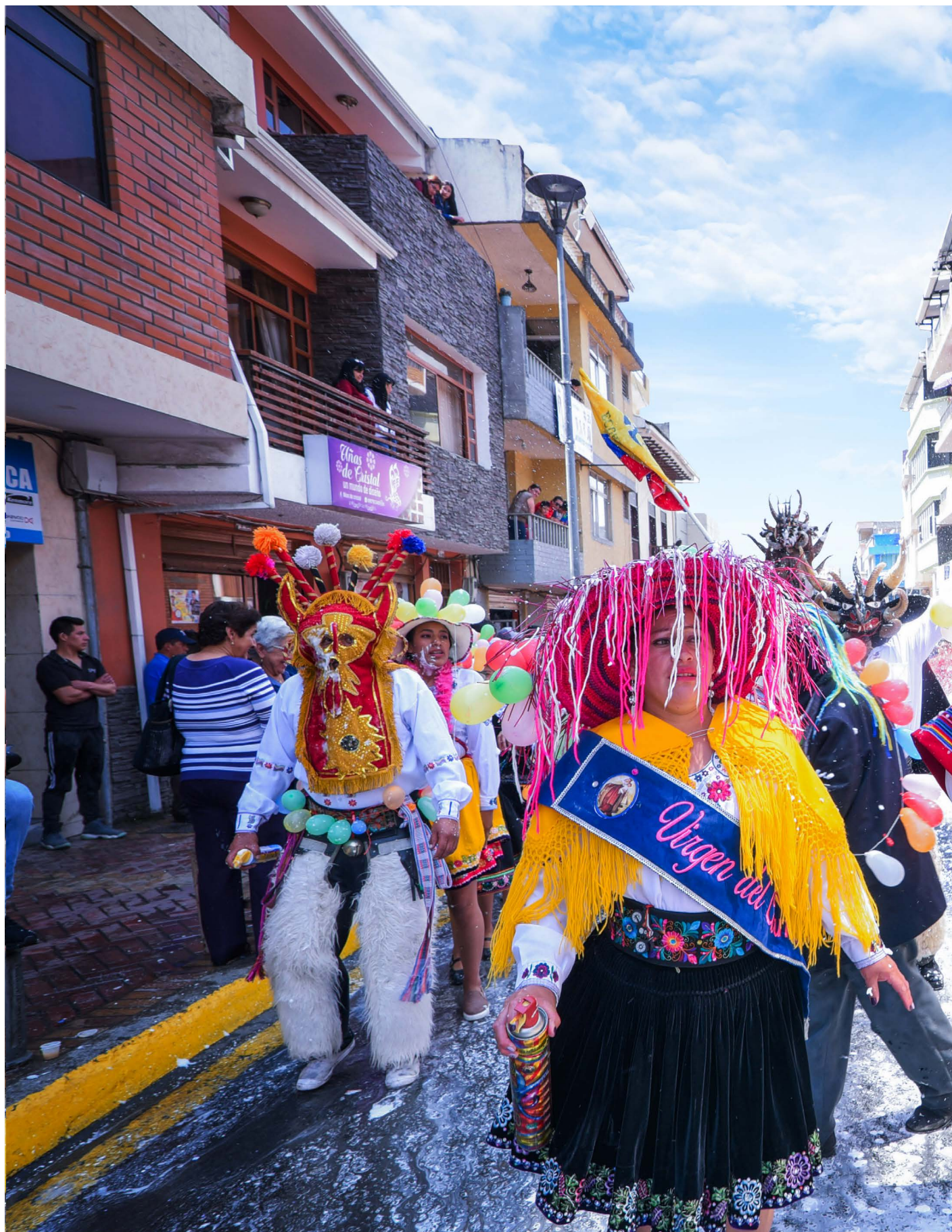
El Huasi Tupac.