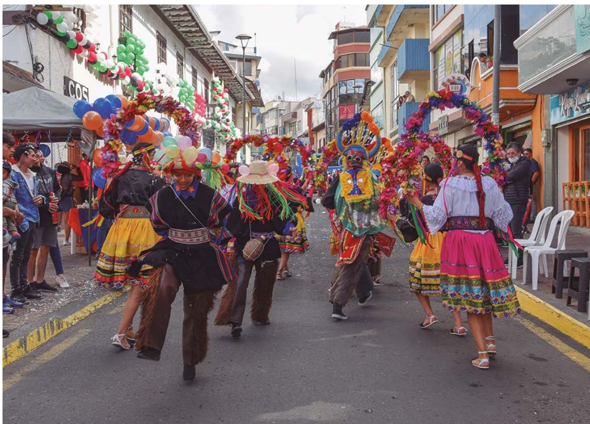
Danza folklórica de los ruku yayas.