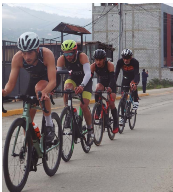
Imagen 6. Momento del circuito de ciclismo

3. Ciclismo.- Después está la fase de ciclismo que se lleva a cabo generalmente en las vías públicas ya menudo cerrado al tráfico, en este caso se desarrolló un circuito de 5 km en cada vuelta, los deportistas cumplieron 4 vueltas del circuito. Los parques grandes con caminos adecuados pueden usarse para dar a los participantes un lugar libre de tráfico. Los recorridos pueden ser circuitos, de ida y vuelta, u otras variaciones.