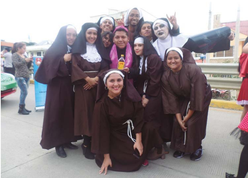
Figura 7. Comparsa en representación religiosa