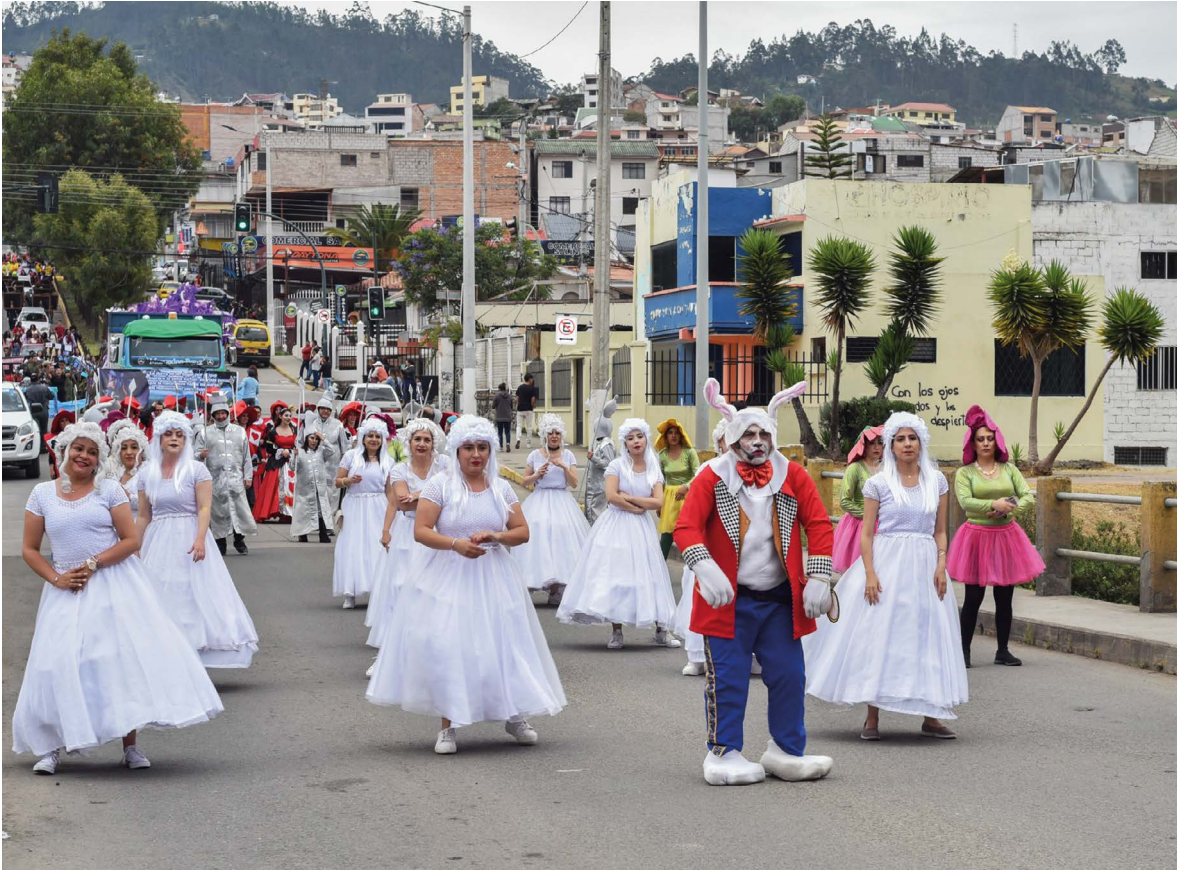
Alicia en el país de las maravillas.