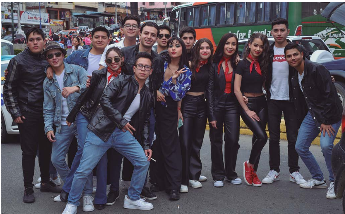
Pinocho y los Estudiantes de Arquitectura.