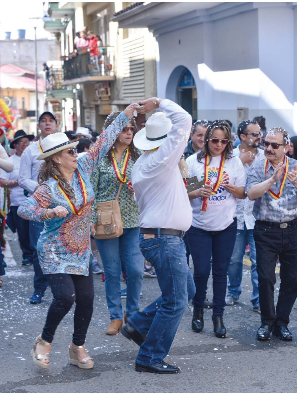
El tradicional baile de los compadres del carnaval.