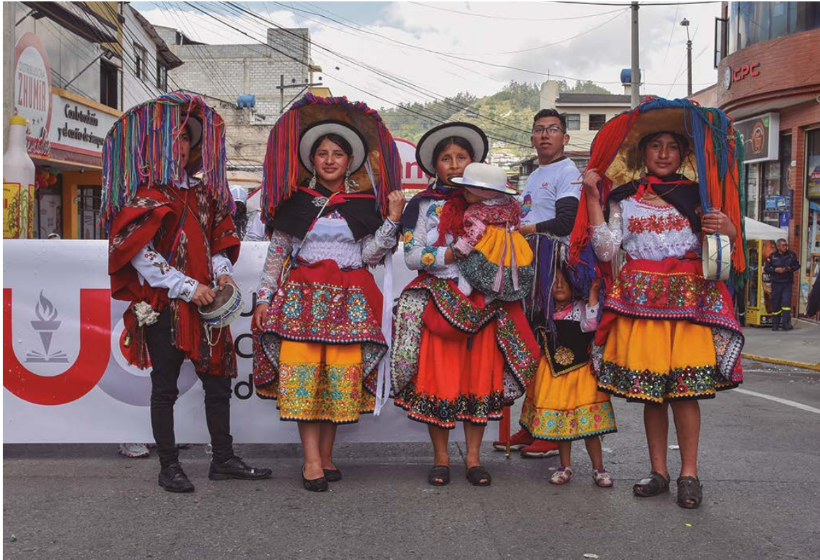
Taita y Mama Carnaval fomentando que la fiesta se vive en familia.