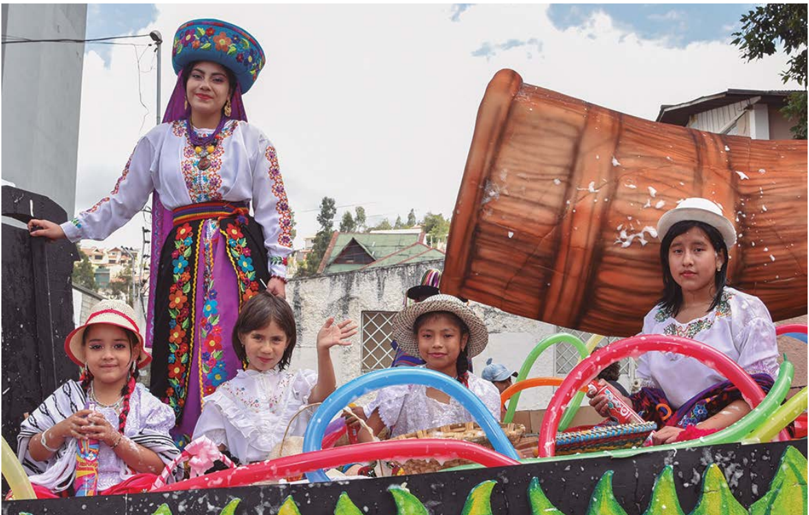
Llegada de los carros alegóricos del Taita Carnaval, la Reina Roja con sus niñas disfrazadas.