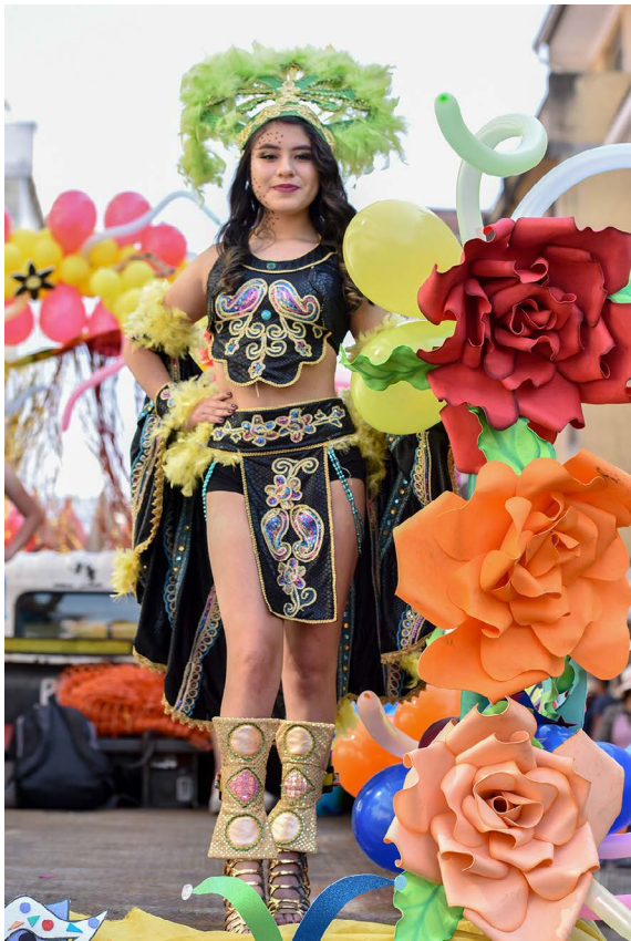
Azogueñas lucen trajes de Garotas y desfilan en carros alegóricos.