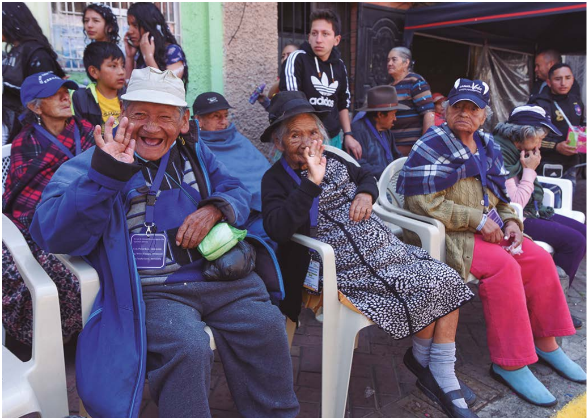
Adultos mayores del Asilo "Rosa E. de León" disfrutando de las comparsas.