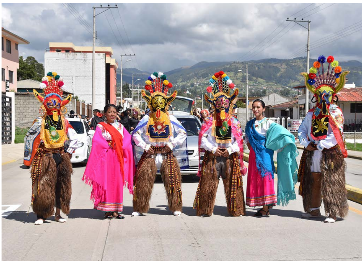
Grupo de danza folklórica.