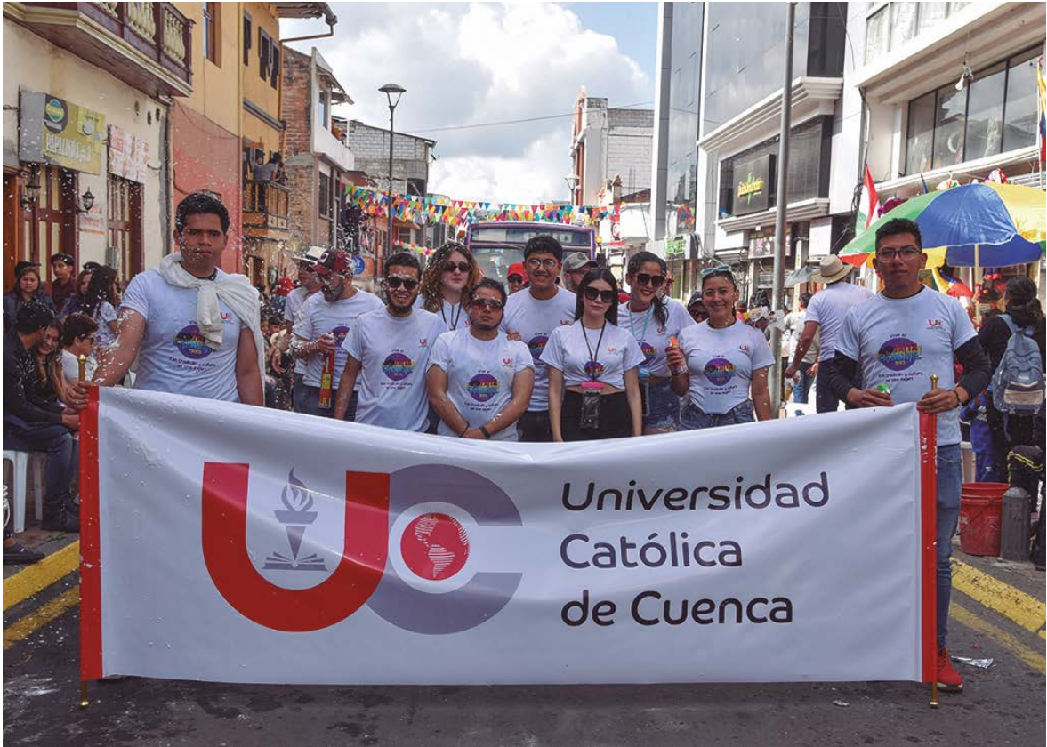
Representantes estudiantiles - FEUCC.