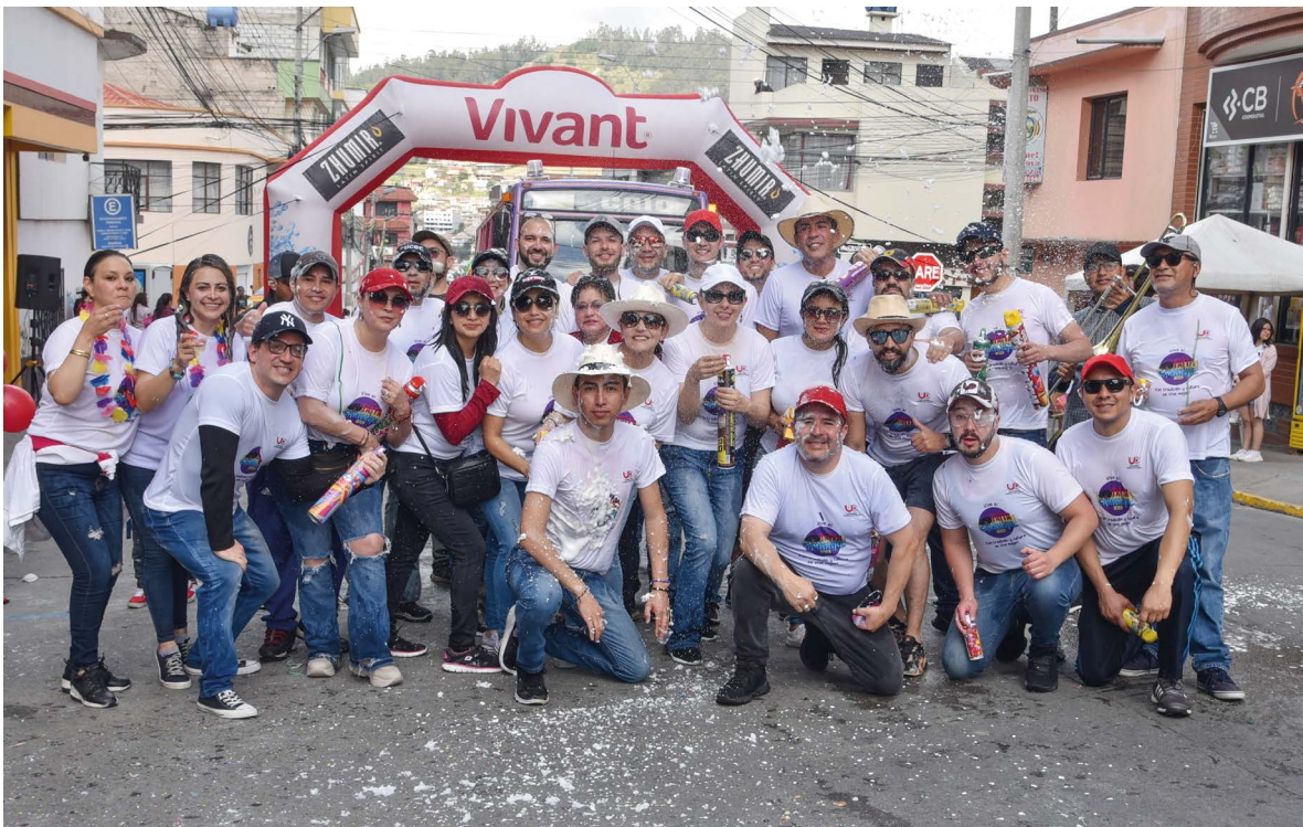
Llegada de los sacerdotes entre desfile y comparsas al compás de la música disfrutando de los tradicionales canelazos.