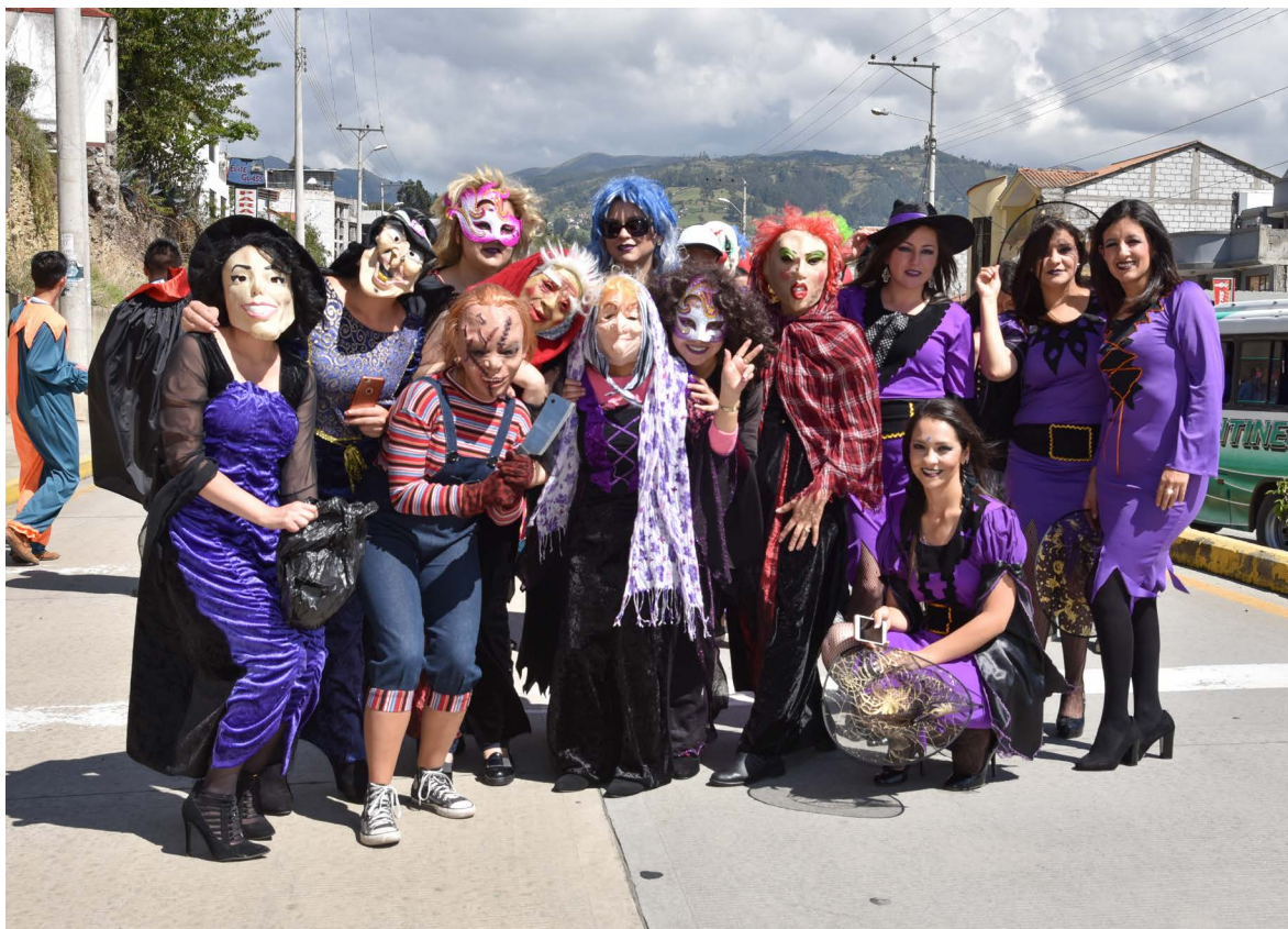
La novia de Chuki. Participan docentes y alumnos de Derecho.