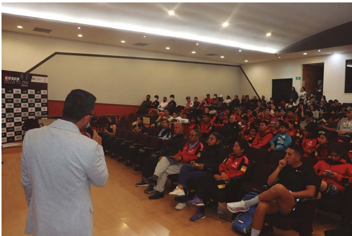
Imagen 3. Momento del congresillo Técnico

Con el objetivo de verificar que todo transcurriera dentro de lo planificado, la semana previa al evento se desarrolló un simulacro de la competencia, para pulir detalles en cuanto a la ruta, distancias, ubicación de jueces y tiempos estimados de duración por categoría; de igual manera se dio la socialización del evento con los residentes del sector, pues se consideró sus necesidades ya que sobre ellos recae la mayoría de los beneficios y costes sociales de la celebración del mismo (Fredline et al., 2001), pues las vías aledañas permanecieron cerradas y debían tomar las previsiones necesarias. El día previo al evento se planificó la entrega de camisetas, chips, bolso y productos de los patrocinadores, así como también el congresillo técnico, en el cual el director del evento, dio los detalles del mismo, recalcando que el evento de rige bajo el reglamento de la World Triatlón y solventó las inquietudes de los deportistas que se hicieron presentes en el local del Paraninfo “Marco Vicuña Domínguez” de la UCACUE sede Azogues.