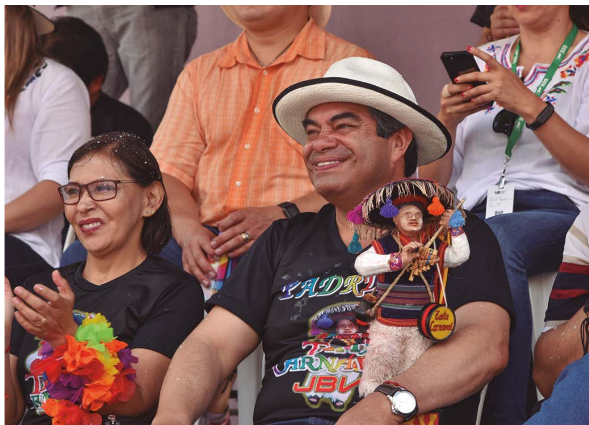
Los compadres a su llegada en la Unidad Educativa Juan Bautista Vásquez.