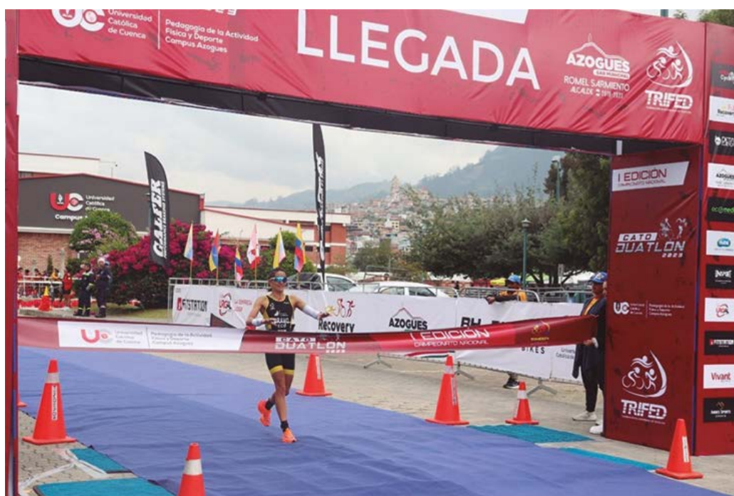
Imagen 8. Momento de la llegada al concluir la segunda carrera a pie.

5. Carrera a pie.- La competición termina con la carrera a pie de 5km nuevamente. Se realiza en la mayoría de eventos similar a la primera a carrera a pie y concluye en esta ocasión en la meta, culminando el evento del duatlón.