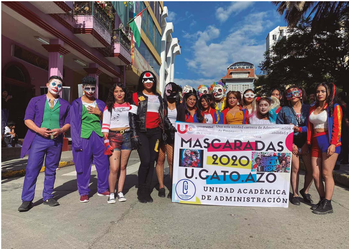
Escuadrón suicida - Alumnos de Administración, Contabilidad y Auditoría.