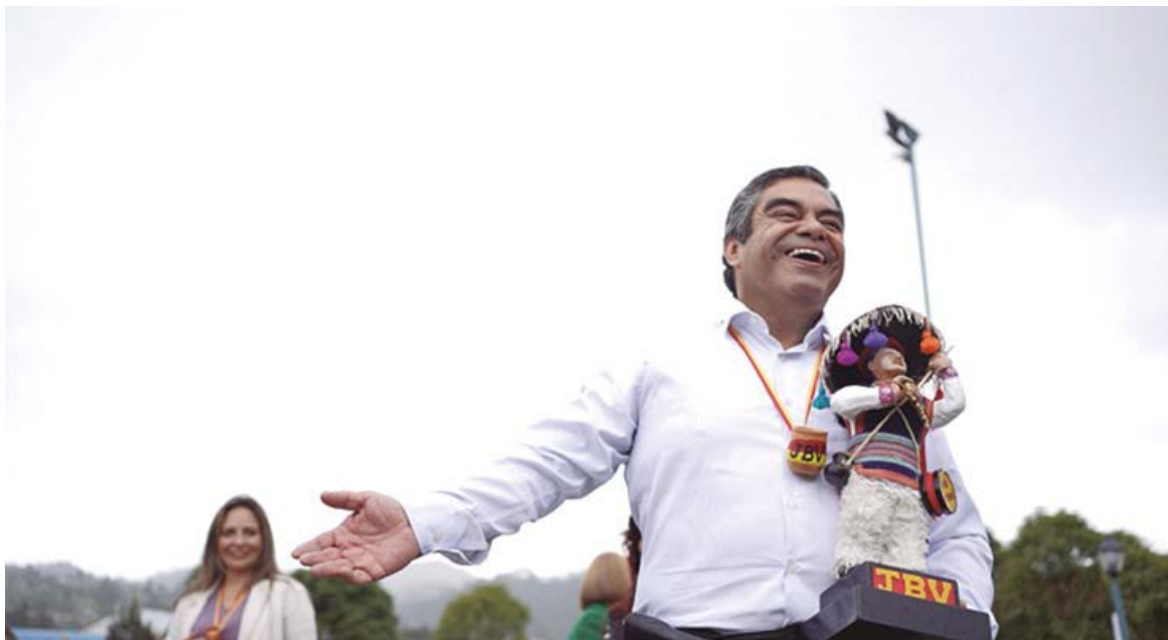
Figura 2. Enrique Pozo Cabrera, rector de la Universidad Católica de Cuenca, exalumno del Instituto Juan Bautista Vázquez, designado padrino del Taita Carnaval 2023

comprometió el apoyo directo y participación activa, tanto de docentes, personal administrativo y estudiantes de las diferentes carreras en los eventos a realizarse en los siguientes años.