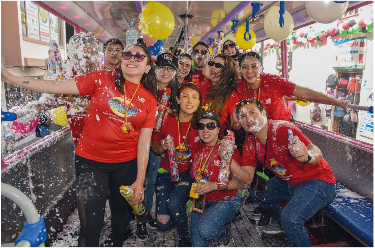
El Centro de Idiomas disfrutando del carnaval a bordo de una Chiva.