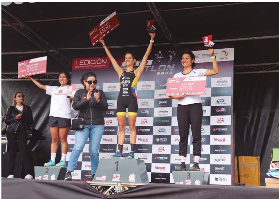
Imagen 9. Momento de premiación categoría elite damas.