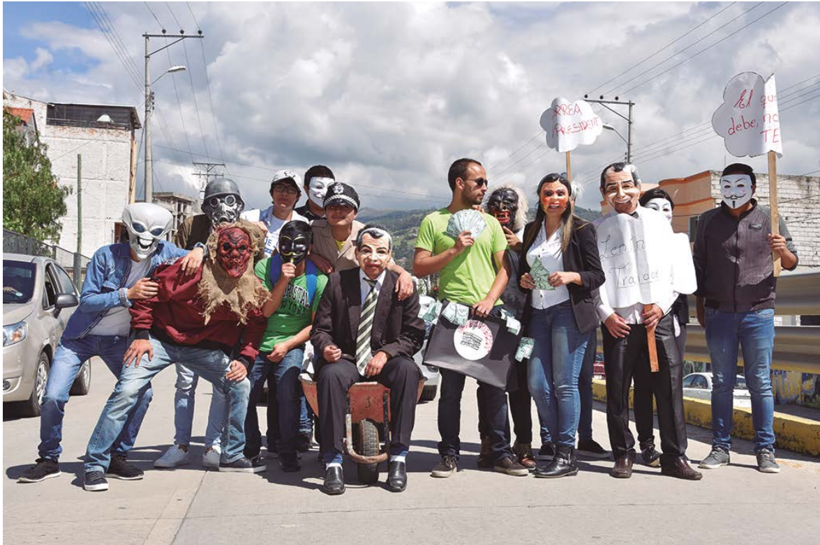
Parodia al gobierno de Lenin Moreno y los casos de corrupción ODEBRECHT Ecuador. Participan alumnos de Ingeniería en Sistemas.