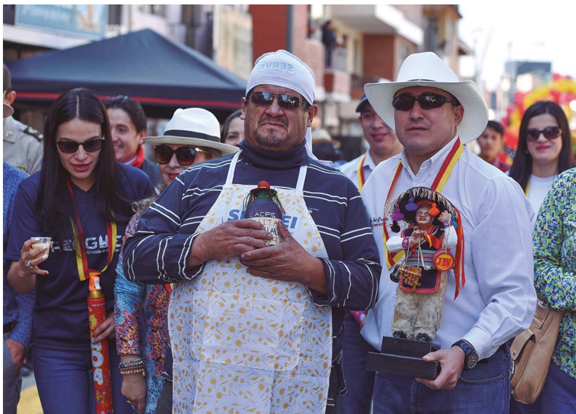
Al son de la música y con el deleite de la tradicional chicha da inicio el recorrido.