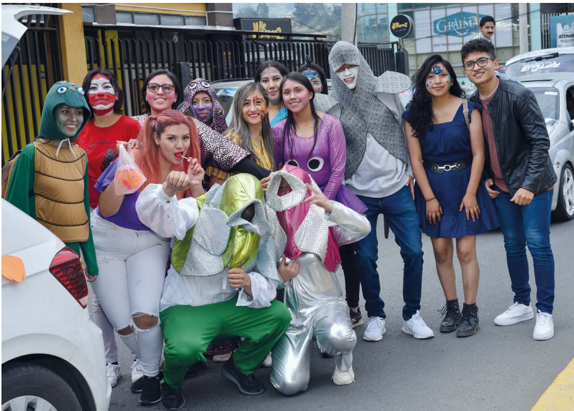
Buscando a Nemo.