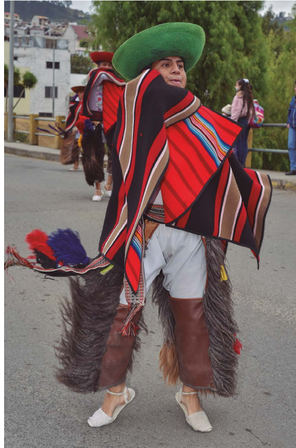
Grupo de danza folklórica.