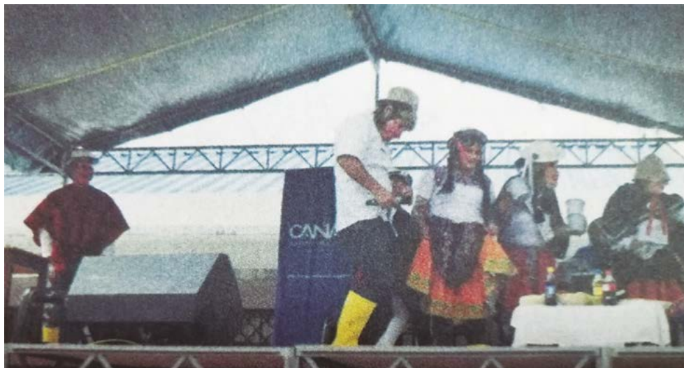
Figura 3. Mascaradas en la ciudad de Cañar

Nota: Adaptado del archivo de Semanario El Heraldo del Cañar. Comparsas de mascaradas en la ciudad de Cañar- Ecuador, 2018