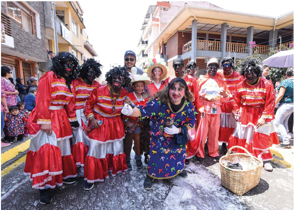
Las mamas negras y la Carishina.