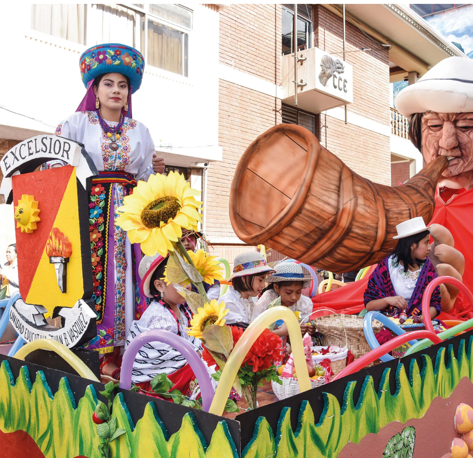
Carro alegórico con el Taita Carnaval.