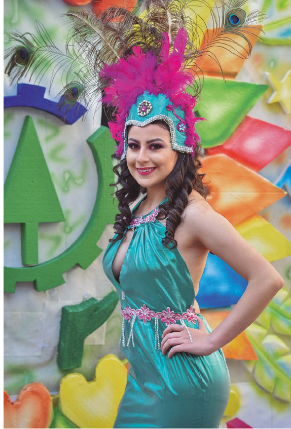
Reina de CACPE junto al carro alegórico.