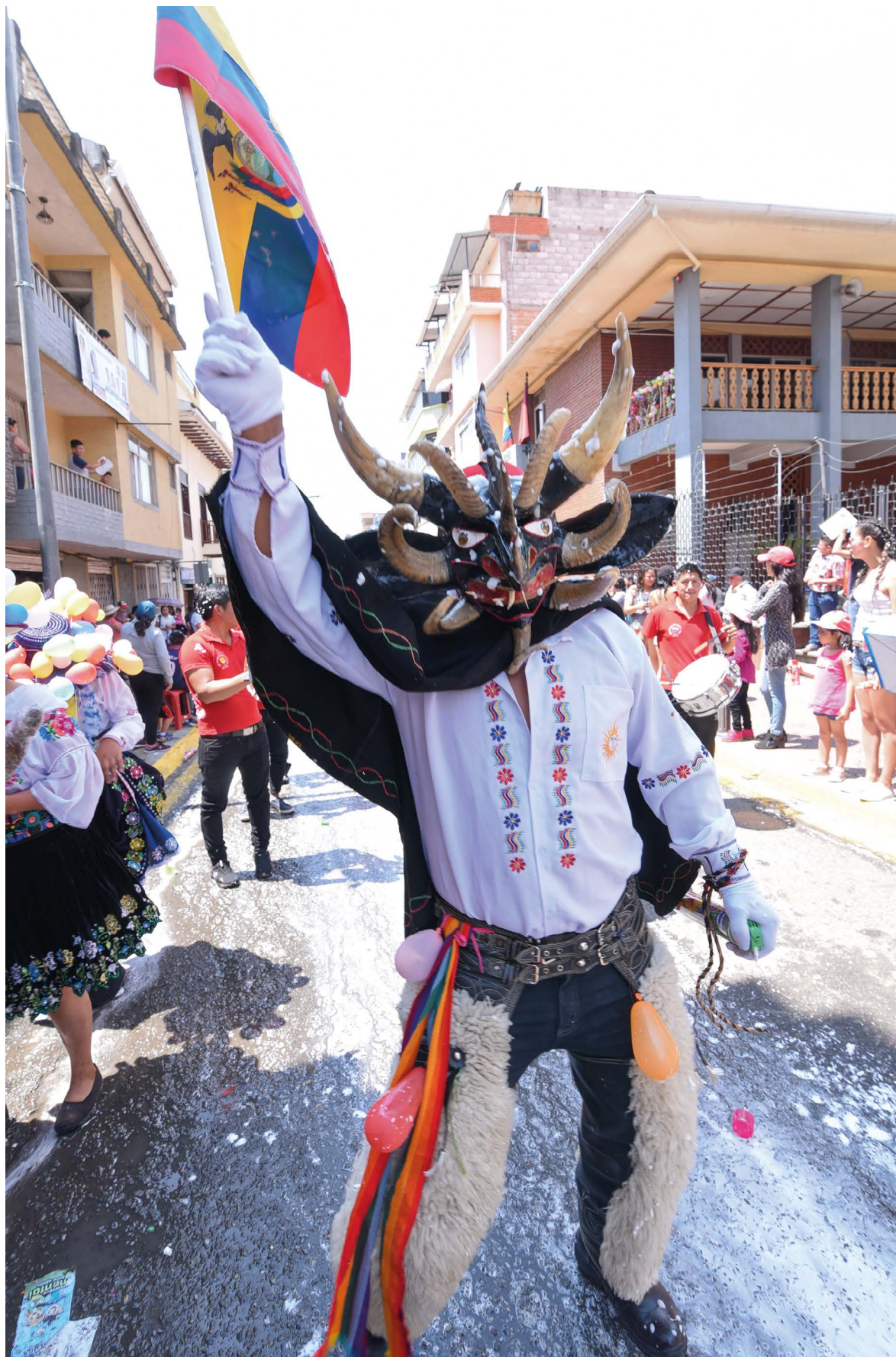
El Diablo del Carnaval con sus trajes y comparsas celebrando el carnaval.