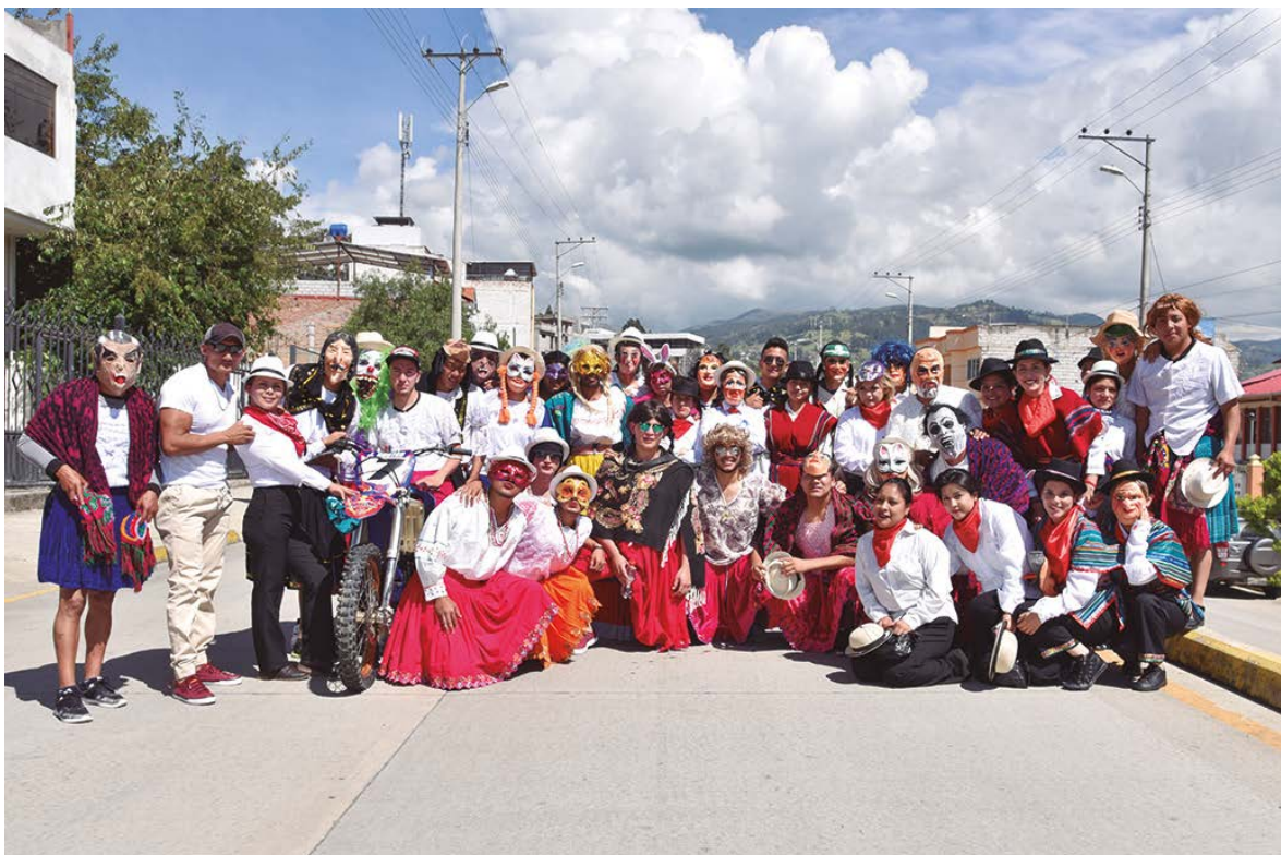
Hef y sus chicas Playboy.