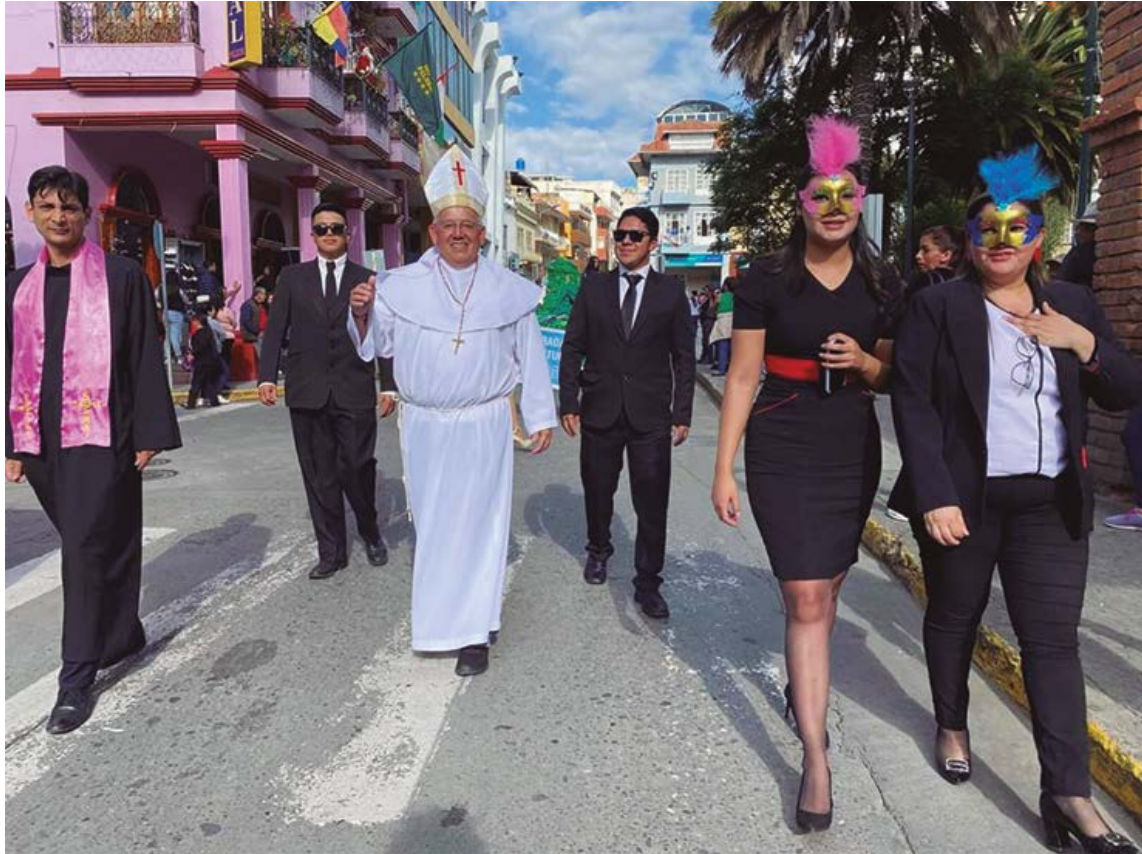
Figura 10. Comparsa los Zánganos del Páramo

Nota: Adaptado del archivo digital de Cato Unidad. Comparsa ganadora de la cuarta edición de las Mascaradas 2020