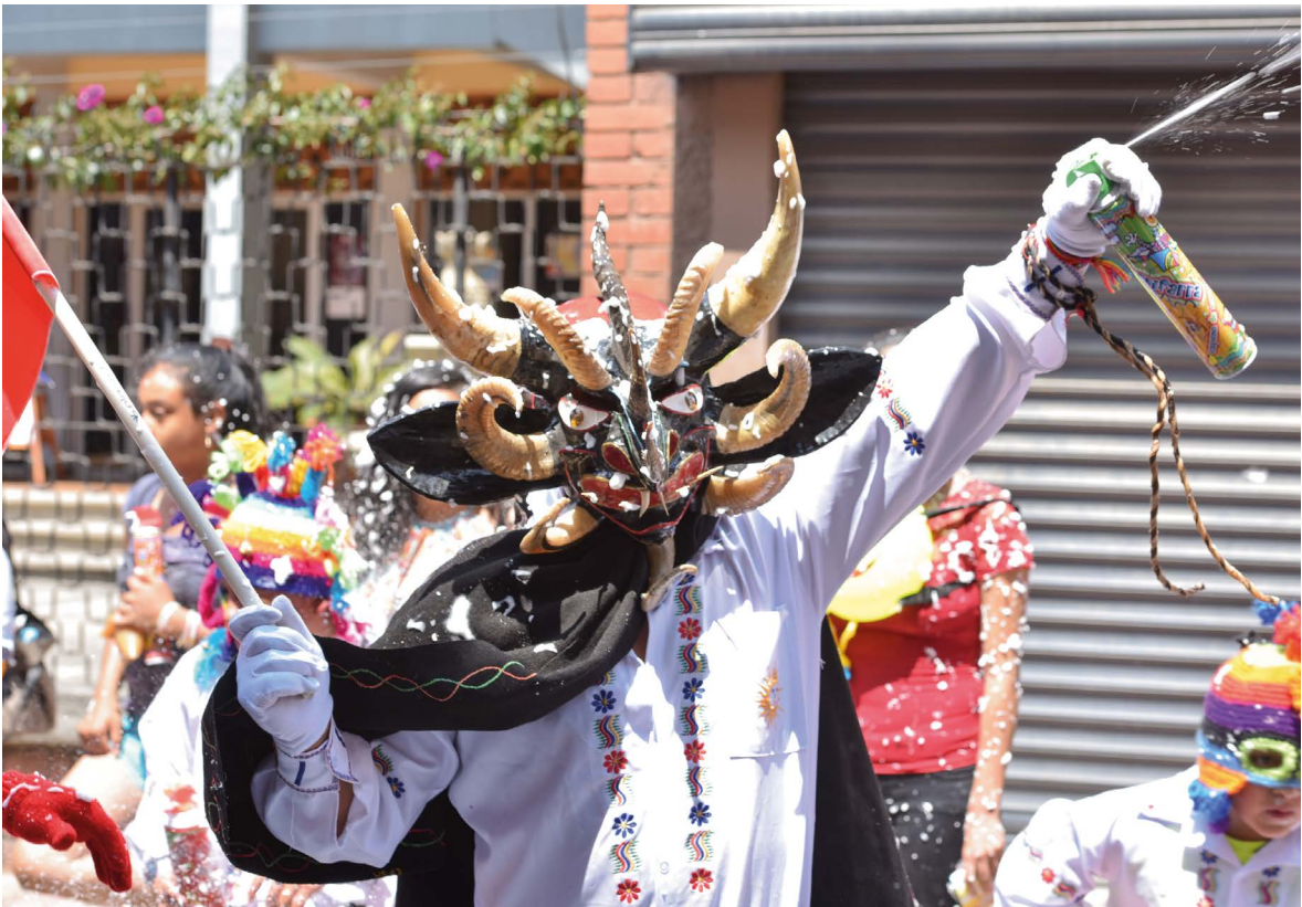
El Diablo del Carnaval con sus trajes y comparsas celebrando el carnaval como una fiesta popular.