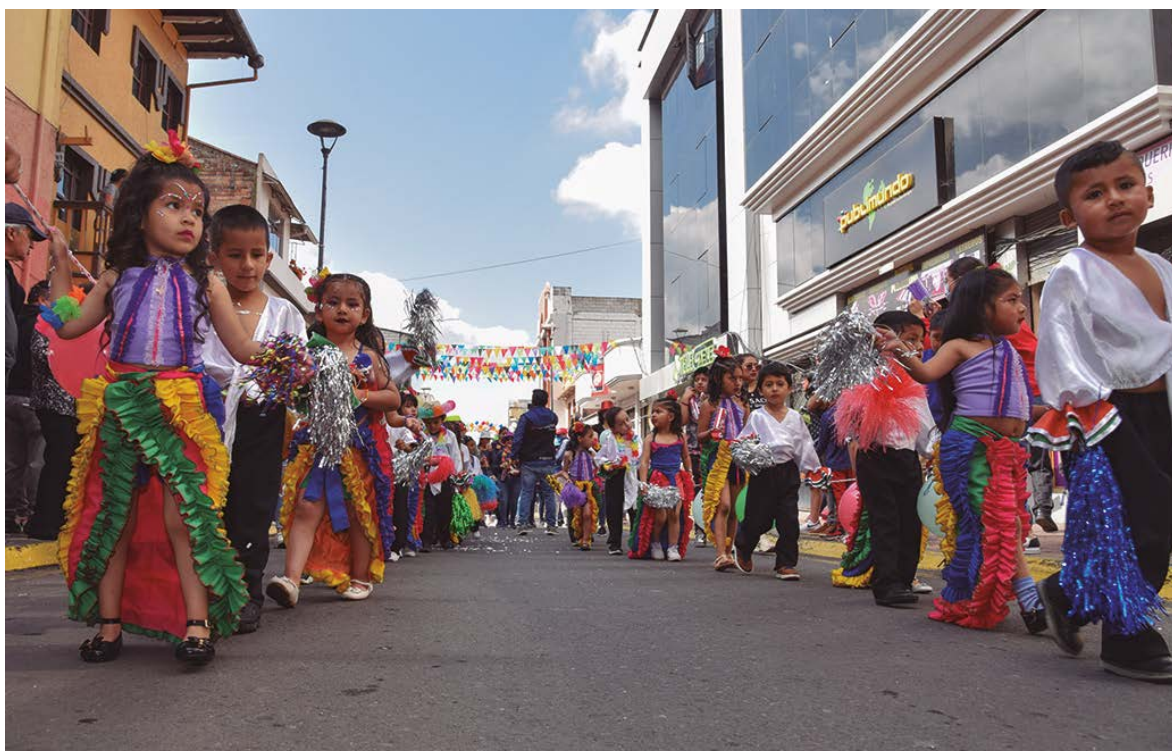
Presencia de los centro de educación inicial.