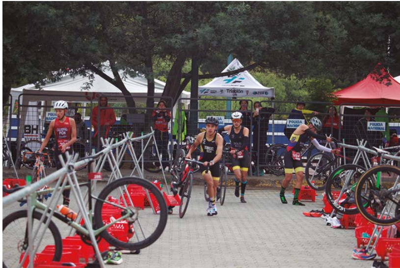
Imagen 5. Ingreso a transición 1 en el parque de bicicletas por parte de los deportistas.

2. Transición 1 (T1). Después de correr, los atletas ingresan y completan una transición en el parque de bicicleta esto se denomina (T1), todo el equipamiento de los atletas está situado en el área de transición, que se convierte en un punto central durante el evento. Las áreas de transición son generalmente rectangulares y una transición solo significa que todos los atletas registran la misma distancia al realizar la compensación en la transición.