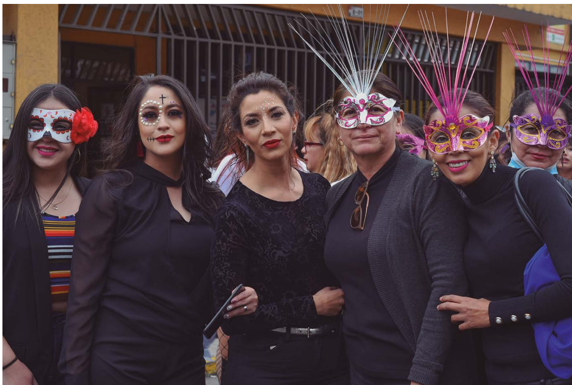
Personal docente de Enfermería.