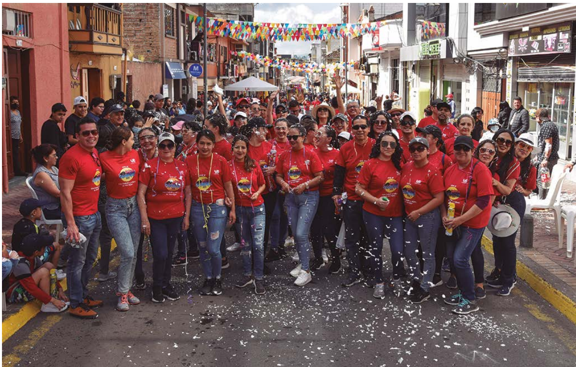
Docentes y personal de la UCACUE campus Azogues.