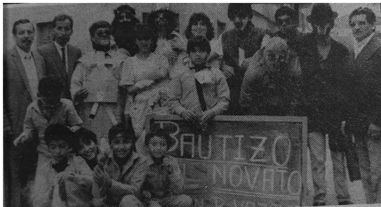
Figura 1. Mascaradas del año 1989

comparsa ganadora: El bautizo del novato, 1989