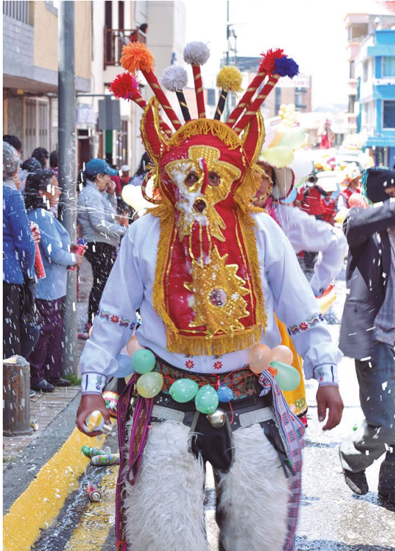
El Ruku yaya (hombre sabio) participan también con danzas y alegría.