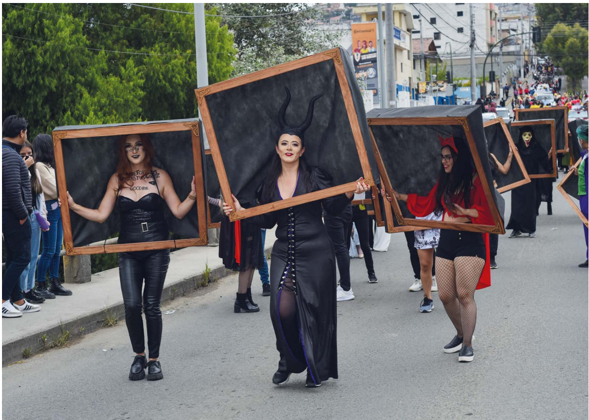
Cuadros vivos de terror.