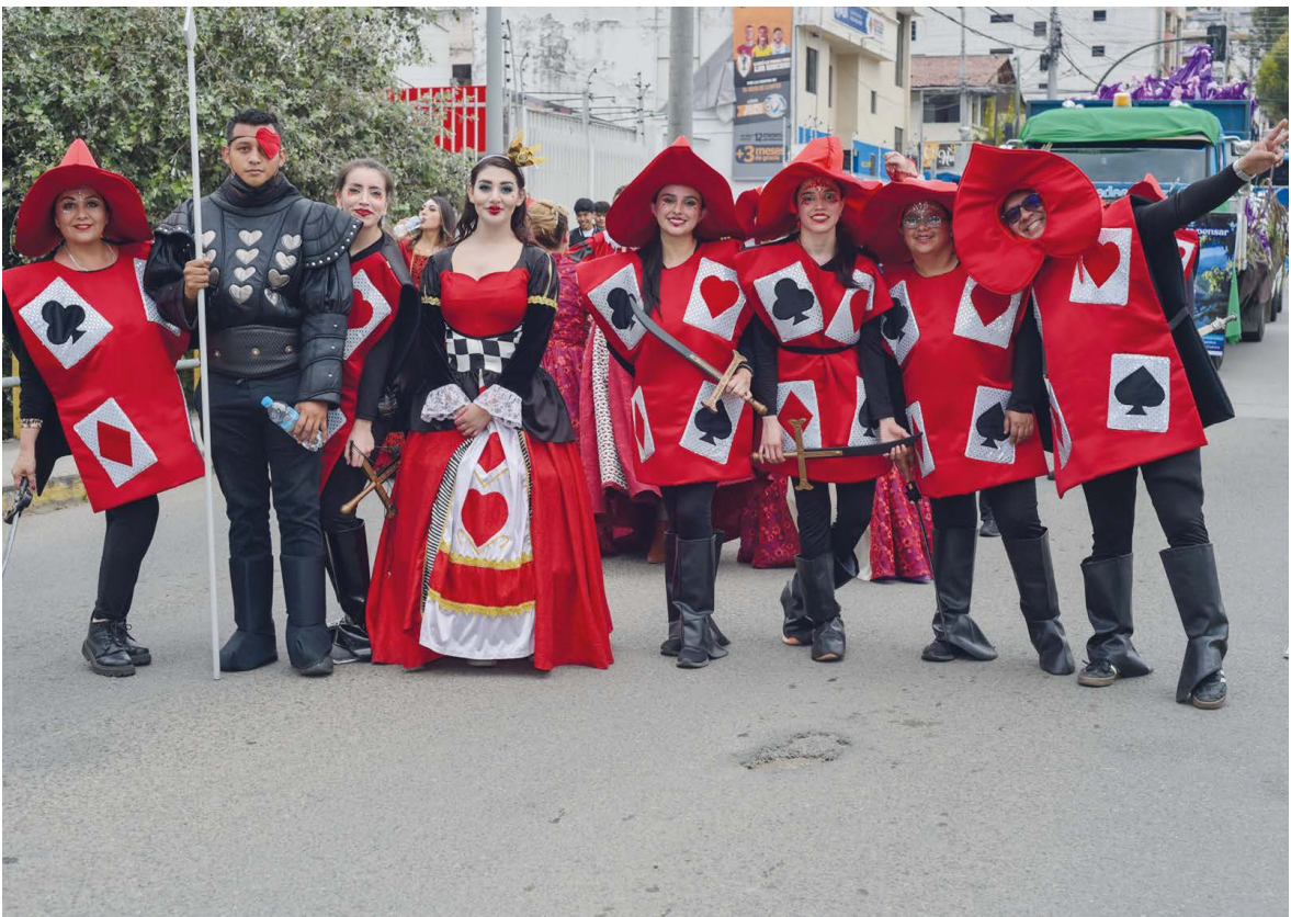
Alicia en el país de las maravillas.