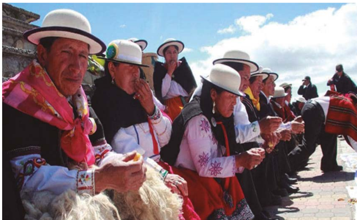
Figura 1. Testimonio de la identidad de la cultura cañari.