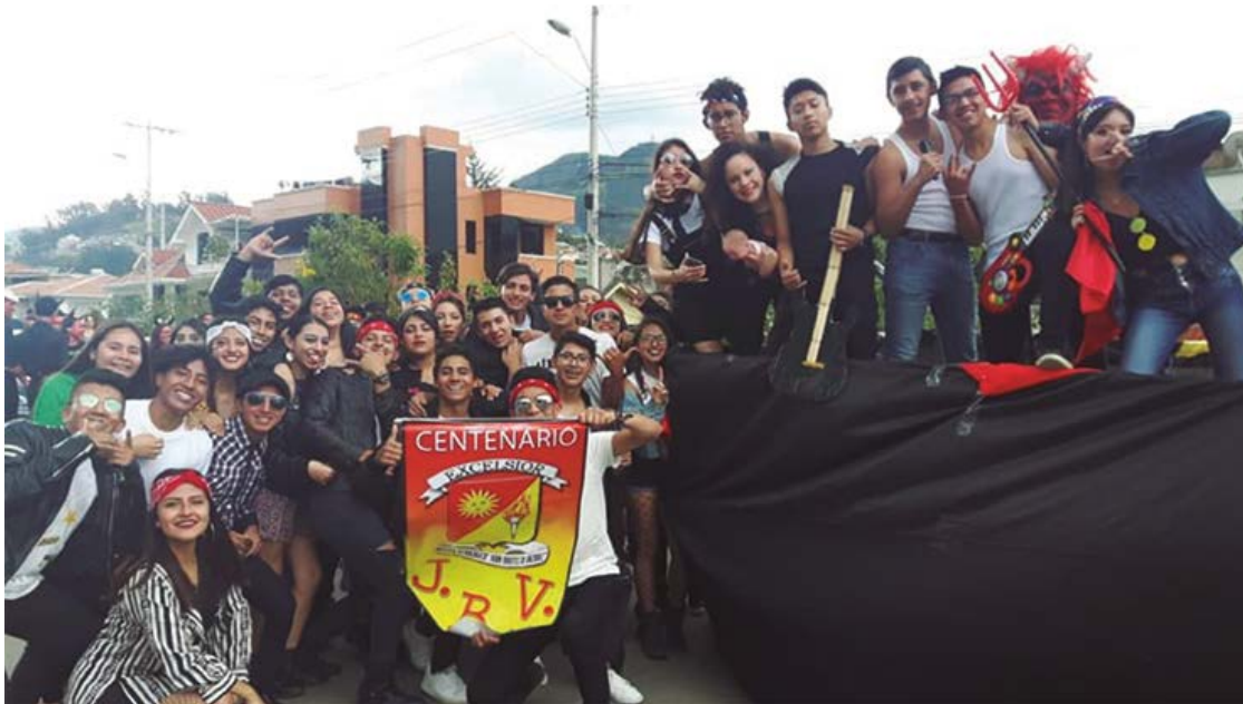
Figura 8. Comparsas alusivas a la “Catedral de la Cultura” el JBV.