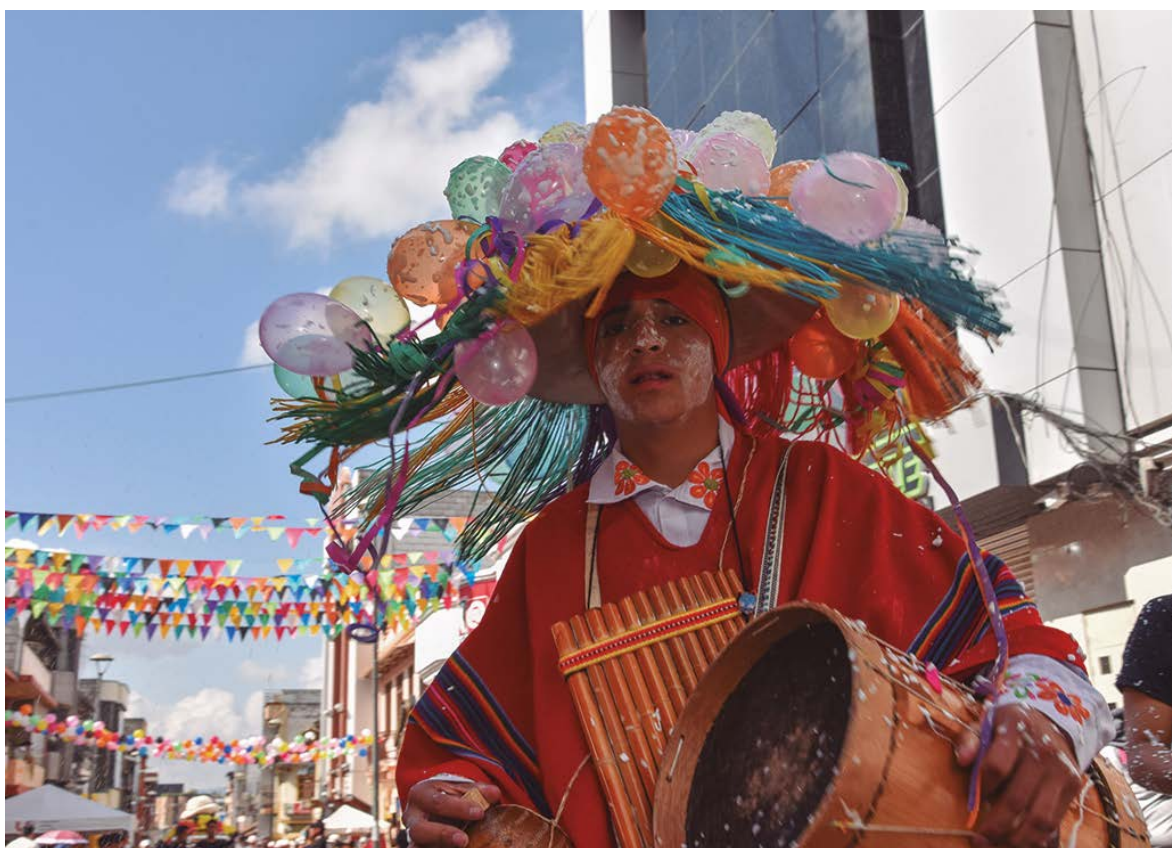
El Taita Carnaval encabezando el desfile y bailes con su tambor y rondador.