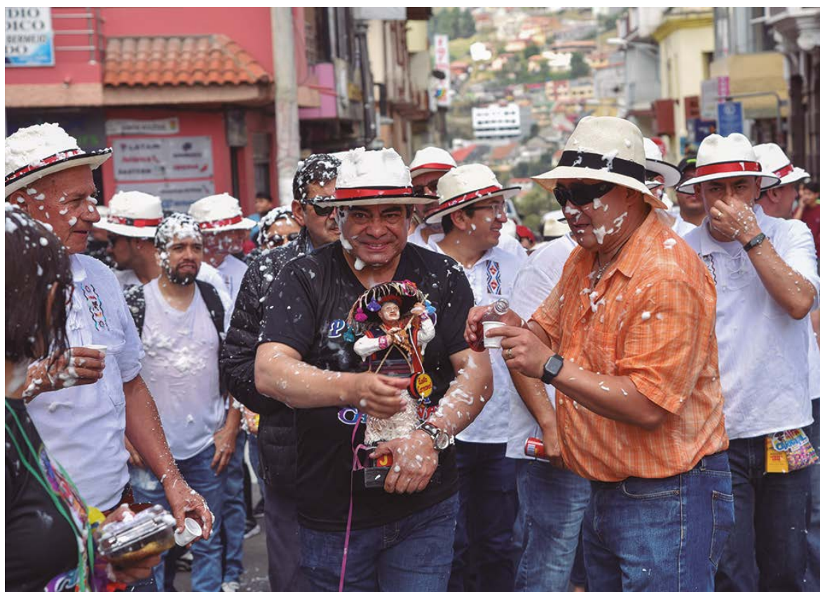
Recorrido de los compadres por las principales calles de la ciudad.