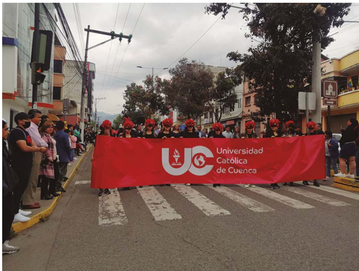
Figura 12. Universidad Católica de Cuenca encabeza el Festival de Mascaradas 2023