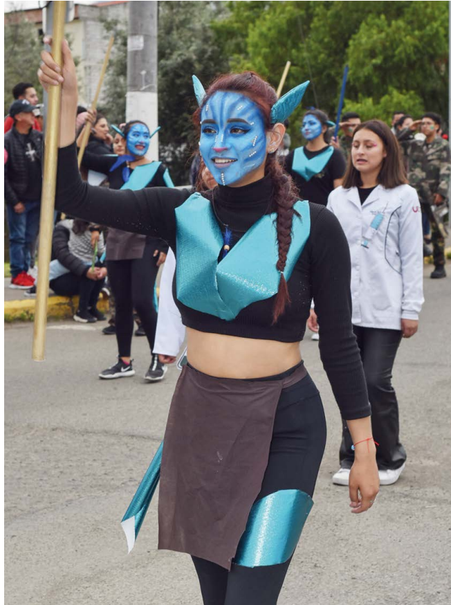
AVATAR: El camino del agua.