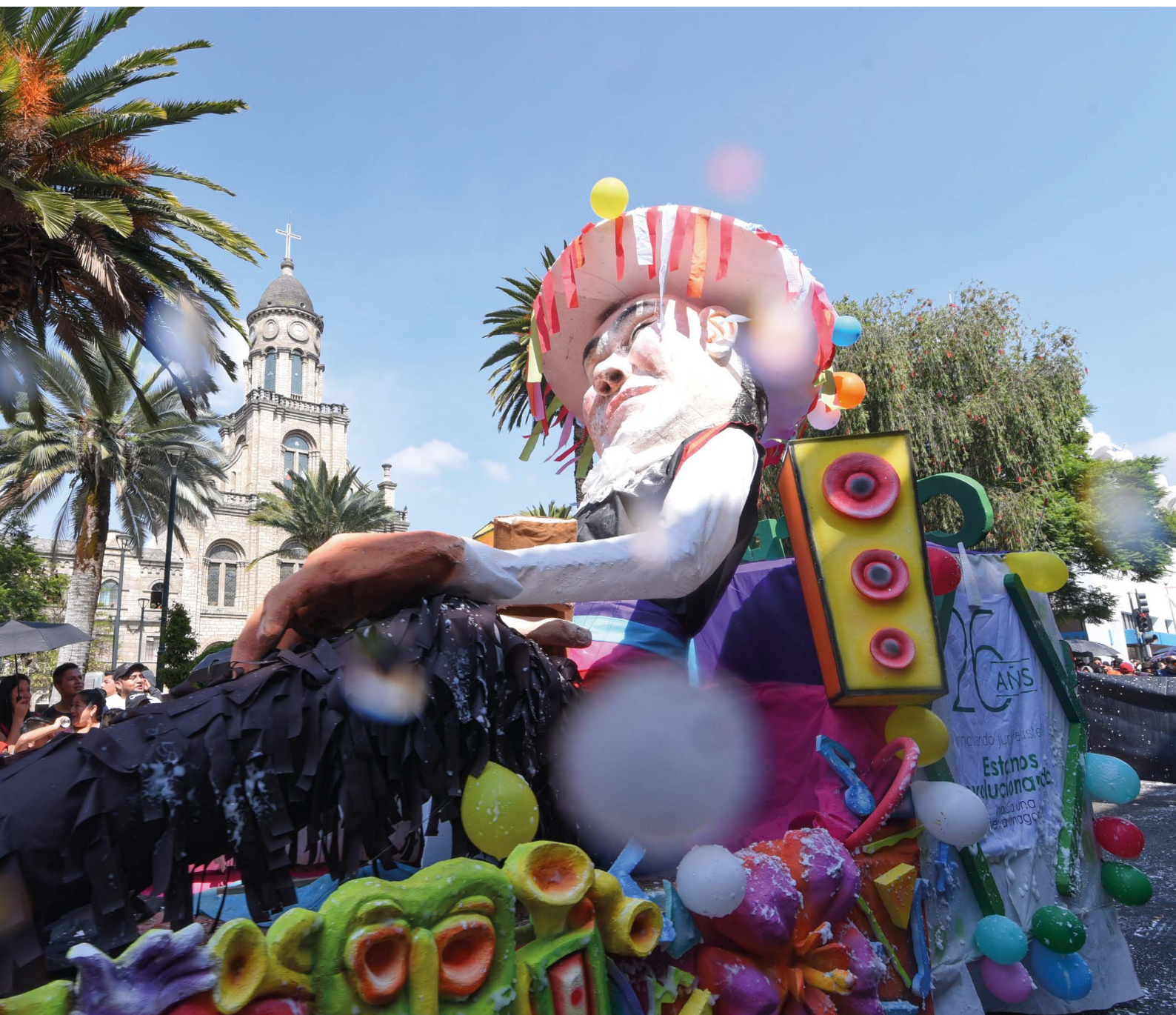
Carro alegórico con el Taita Carnaval.