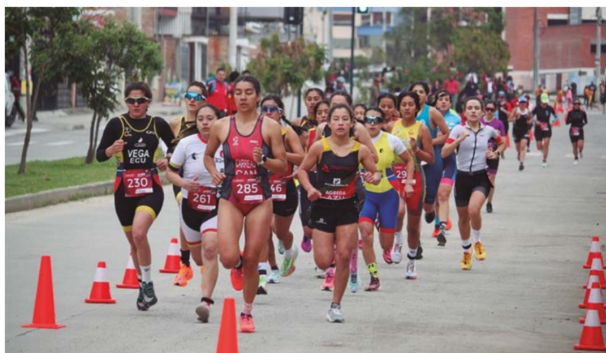
Imagen 4. Inicio del viento en la modalidad de carrera a pie.

1. Carrera a pie. - Inicia con la primera carrera a pie en una distancia de 5000 metros en un circuito de 2500 metros de ida y vuelta. Los recorridos son diversos y a menudo involucran una variedad de terrenos.