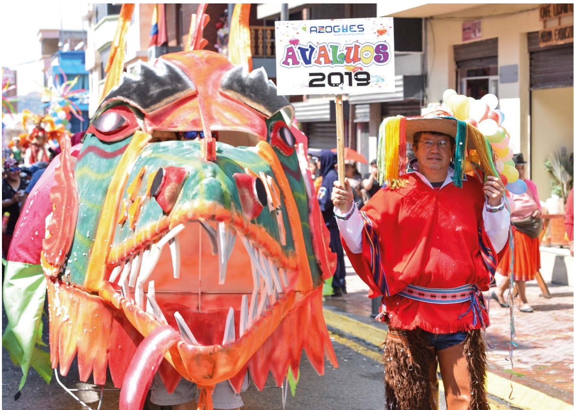
Carro alegórico con el Taita Carnival.