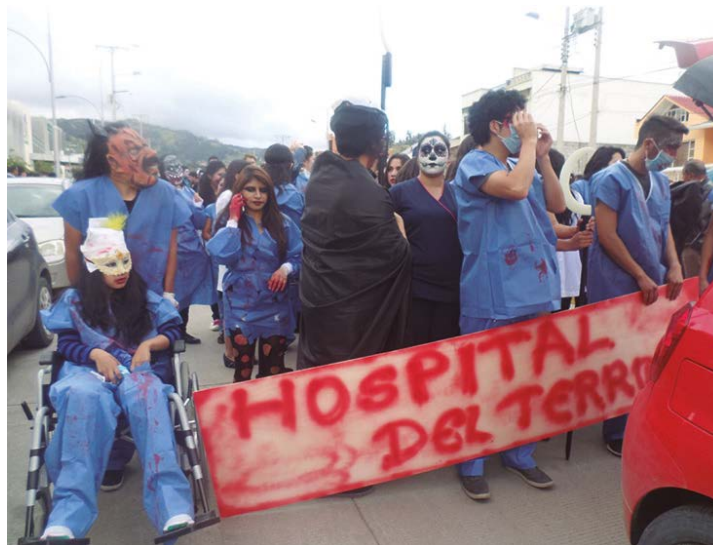
Figura 5. Comparsa Hospital de Terror

Nota: Comparsa Hospital del Terror ganadora del concurso Mascaradas 2018.