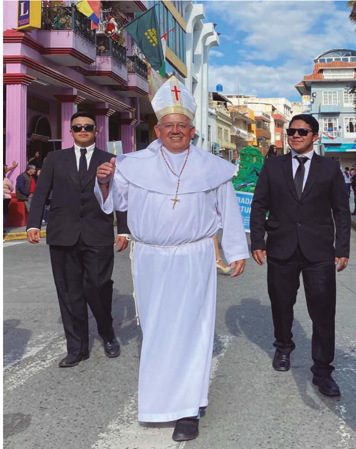
El obispo apertuando el desfile dando bendiciones a todo feligrés.