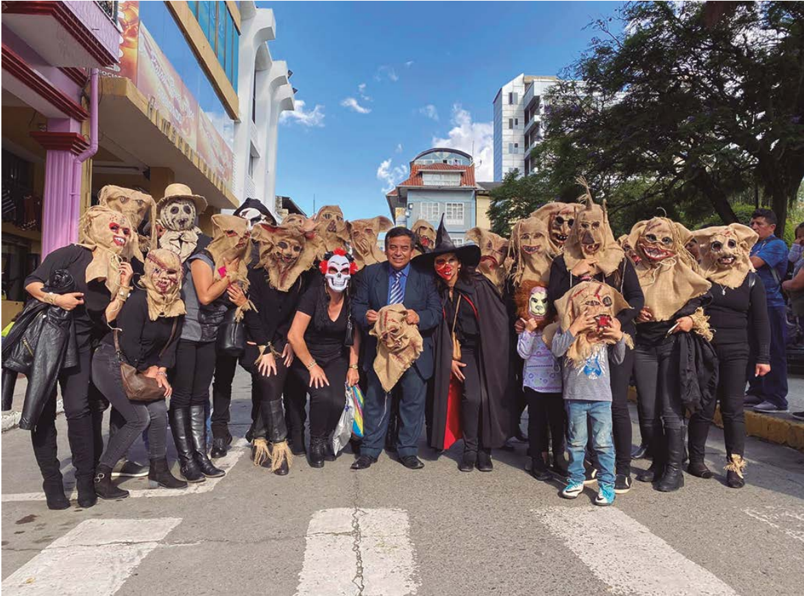
Medicina Veterinaria y Enfermería - Cuenca.