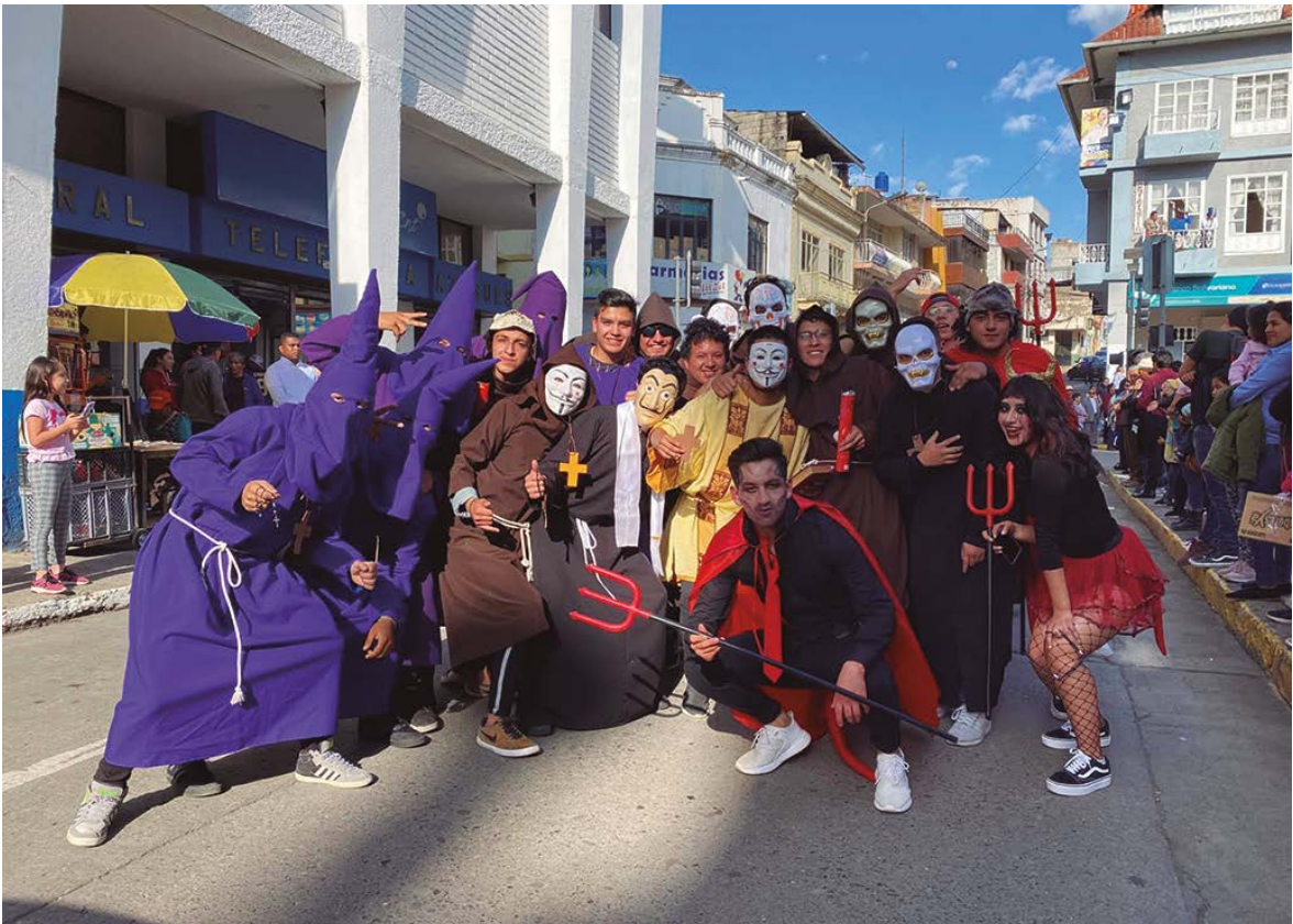
Cucuruchos, curas y demonios.