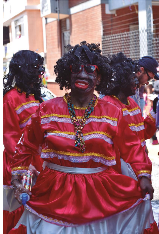
La mama negra.