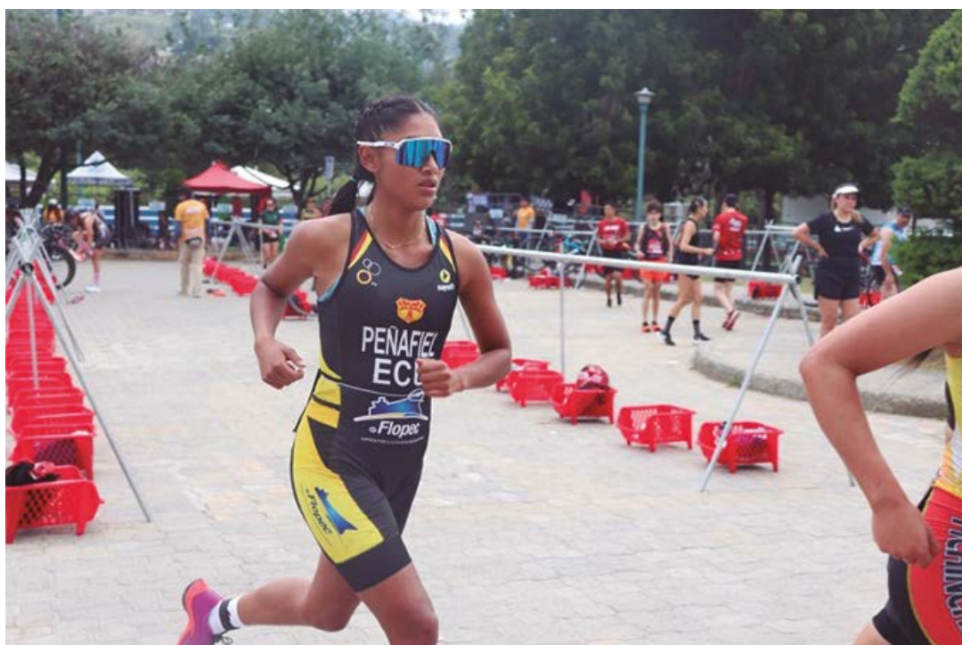
Imagen 7. Deportistas han culminado la Transición 2 en el parque de bicicletas rectangular

4. Transición 2 (T2).- es la segunda transición, de ciclismo a carrera a pie. En la mayoría de los duatlones, las atletas aparcan su bicicleta en la posición de inicio. Por lo general, las atletas cambian de zapatillas de ciclismo a zapatillas de correr en la T2.