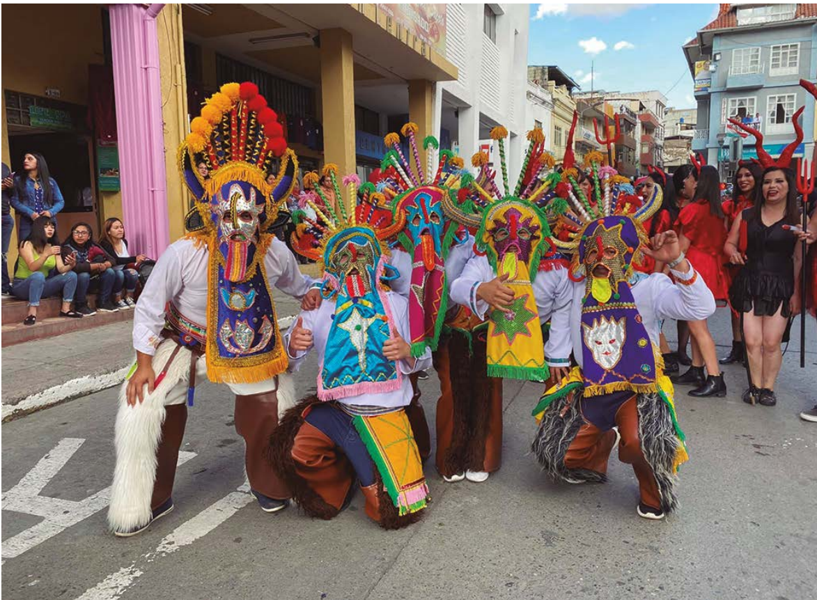
Diablo Huma: Tierra, Sol y Luna.