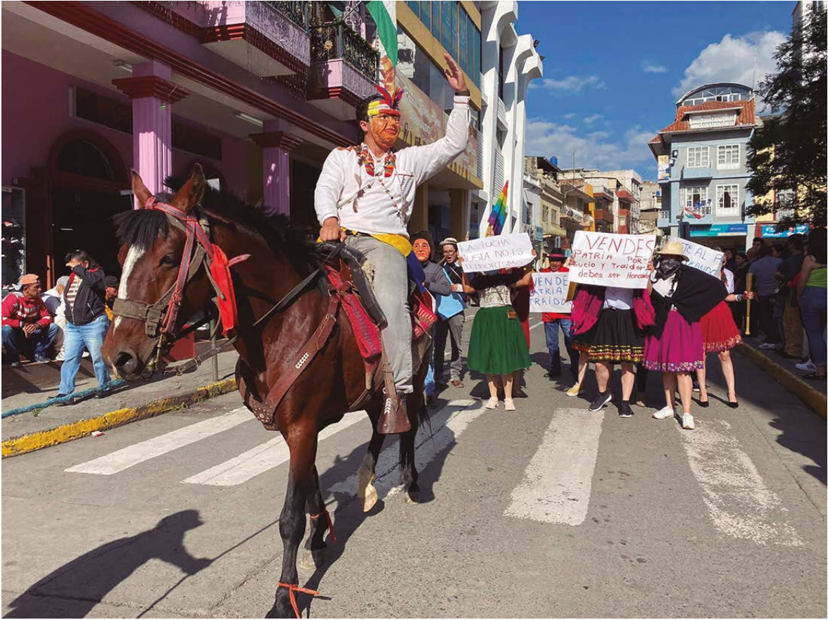
Parodias a los gobiernos de Correa y Moreno.