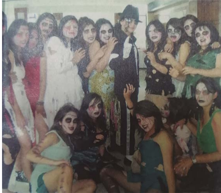
Figura 2. Concurso de mascaradas en Azogues

Nota: Adaptado del archivo de Semanario El Espectador, enero de 2010. Comparsa de participantes de las mascaradas en Azogues.