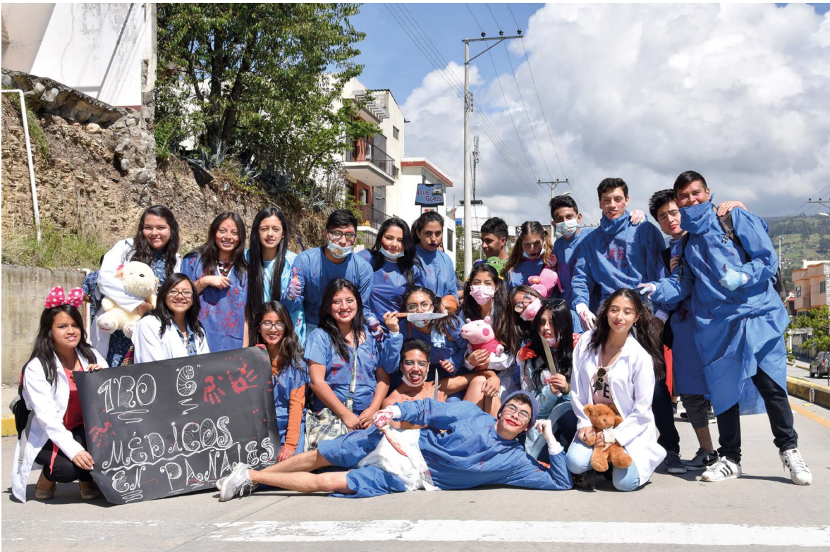
Estudiantes de Medicina y Odontología con sus disfraces y comparsas: Médicos en pañales, el payaso it, catrinas.