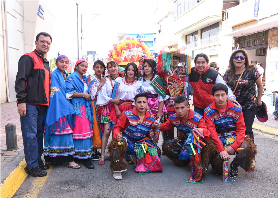
Grupo de danza de alumnos del legendario JBV con sus docentes.